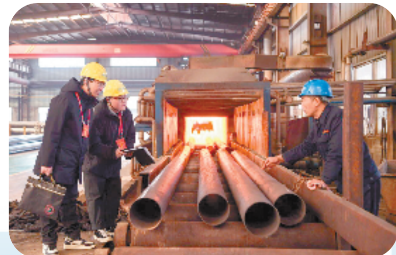
干部深入车间开展助企服务

“营商环境和作风效能建设人人有责,每个人都是参与者,每个人都是建议者,每个人也都是监督者。”从市委十五届三次全体(扩大)会,再到营商环境和作风效能建设大会,龙泉正以时不我待的干劲、静水流深的韧劲,久久为功的韧劲,在优化营商环境上精益求精,在干部作风重塑再造上下实功夫,在破解治理藩篱上啃硬骨头,让现代化品质龙泉之船扬帆远航。