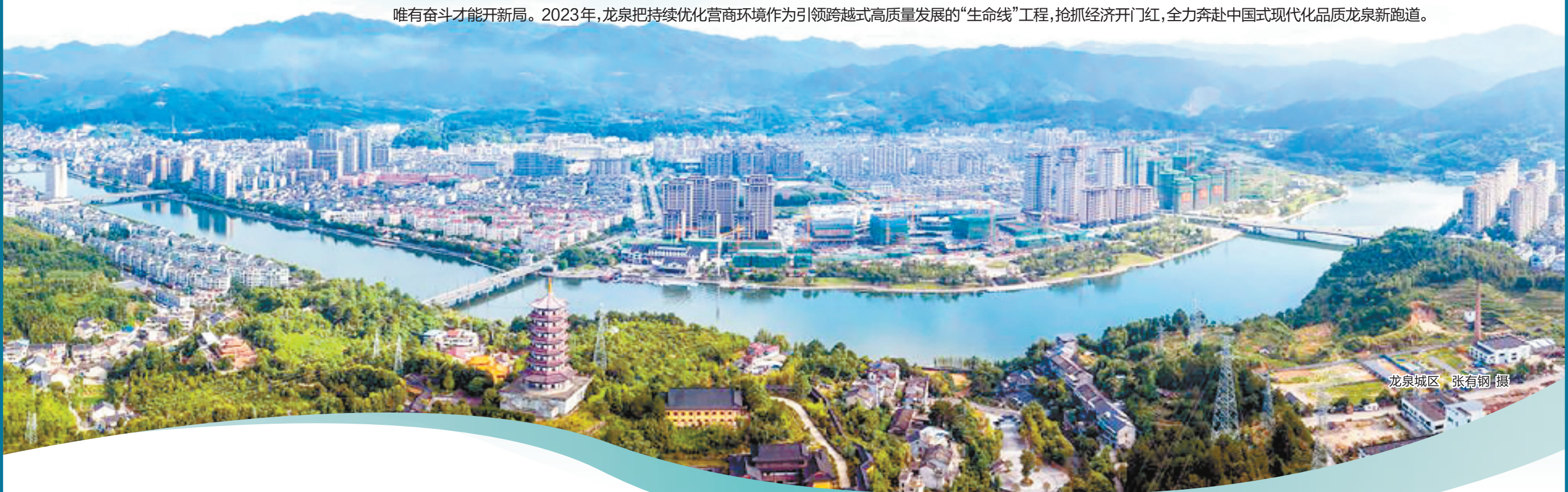
龙泉城区