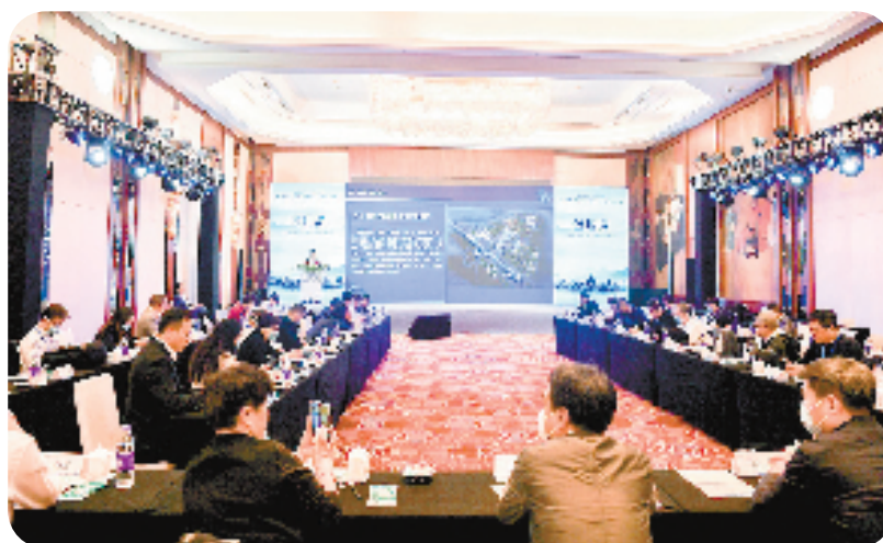
赴上海开展“双招双引”工作