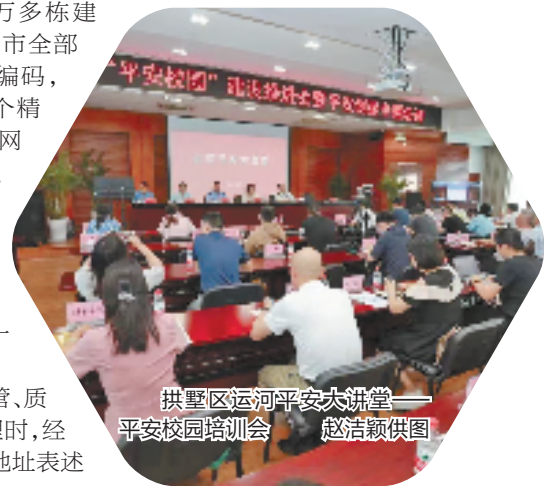
拱墅区运河平安大讲堂——平安校园培训会

杭州市委政法委相关负责人表示,今后,杭州将继续纵深推进市域社会治理现代化试点和平安创建,加快打造“全国数字治理第一城”、市域社会治理现代化标杆城市和平安中国示范城市,为高水平打造“数智杭州 宜居天堂”、加快构建浙江高质量发展建设共同富裕示范区保驾护航。