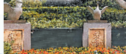
蔡马人家小区

针对居民反映的难事要事,蔡马人家小区坚持众人的事众人议,打造“三方红盟会”进行民主协商议事,完成了非机动车梯改坡道、屋顶统一建晾衣架等一大批民生实事项目。