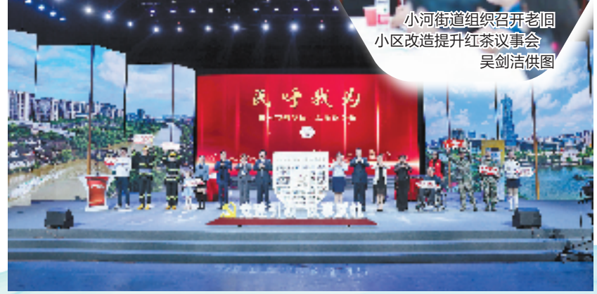
小河街道组织召开老旧小区改造提升红茶议事会 吴剑洁供图