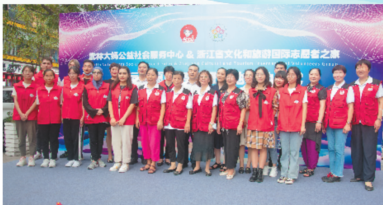
为亚运护航,拱墅区武林大妈与浙江省文旅国际志愿者携手成立亚运志愿服务联盟。

杭州在防范化解各领域风险上进行了有益探索实践,其中防范化解社会矛盾风险等经验做法在全国市域社会治理现代化试点工作交流会、研讨会作