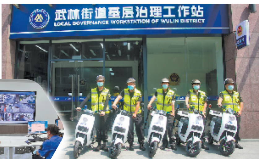
基层治理工作站

区的企业、商家、群众见证了议事经验与成效,也为小河共治、街区治理、攻坚克难等重点问题提供了小河基层治理的经验与方法。接下来,小河街道将围绕数字化改革,深化“红茶议事会”轻应用场景,发布《红茶议事会基层民主协商工作规范》团体标准,实现线上线下有机结合的同时,加强各条块协同落地,形成基层协商共治的全流程闭环,全面提升基层民主协商的法治化、制度化、数字化水平,在践行全过程人民民主、探索共建共治共享的社会治理格局中贡献新的经验,用心让“运河孤本地、天堂新市井”慢慢生长成更好的样子。