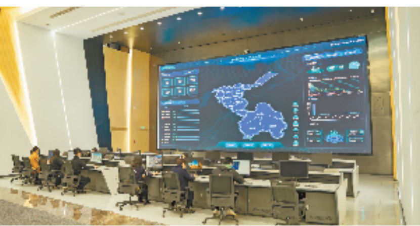
柯桥区社会治理指挥中心