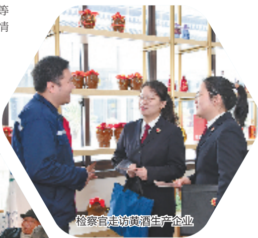
检察官走访黄酒生产企业

“我们的安全感,来自家门口的守护。”一名柯岩街道居民说。去年以来,柯桥区依托“基层治理四平台”,在柯岩街道率先建立街道综合信息指挥室,实现事项“受理—分析—流转—处置—督办—考核”全流程闭环管理,让群众之事事有回应,件件有落实。这也是柯桥区打造“上下贯通、县乡一体”整体治理格局的重要一步。