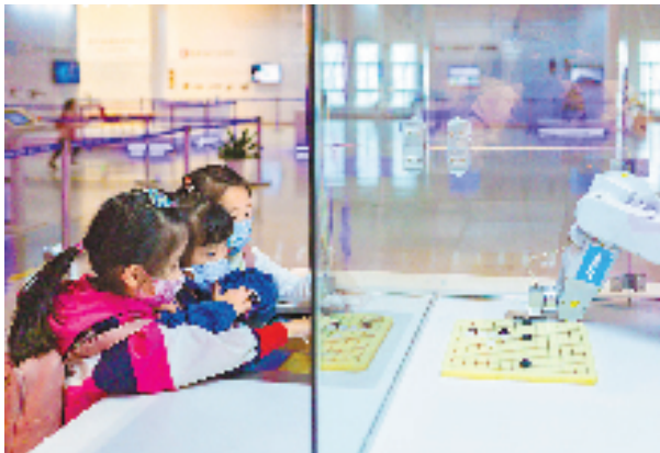
萧山机器人小镇博览中心内,儿童正在与机器人下棋。