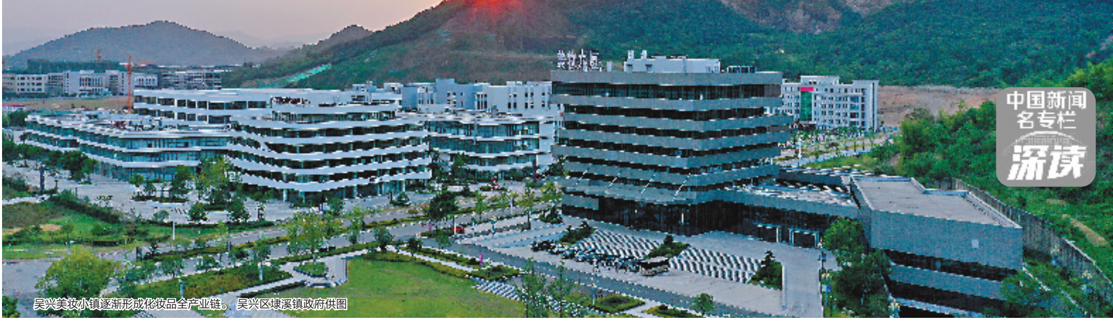
吴兴美妆小镇逐渐形成化妆品全产业链。