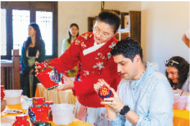
外国游客在绍兴黄酒小镇体验花雕绘制工艺。