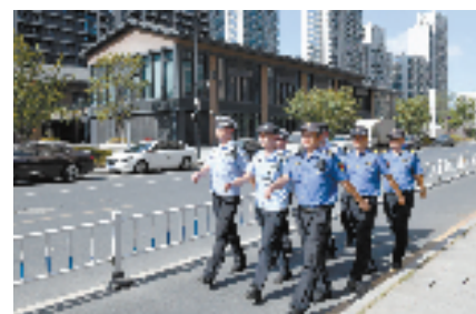
“一支队伍管园区”综合巡查

据悉，青山湖科技城横畈产业园以产业用地为主，产业定位以高端装备和新材料为主导，发展高附加值、高精技术的装备制造及新材料产业。街道结合原有“青和翼”五大防区建设，整合并优化综合执法、市场监管、生态环境、应急管理、劳动保障等执法队伍，以及社会力量包括辖区商会、乡贤等资源，组建并打造横畈产业园综合管理服务站。服务站与科技城管委会、需要参加会议的职能部门和企业，每月定期开展行政执法政企会商，推动涉