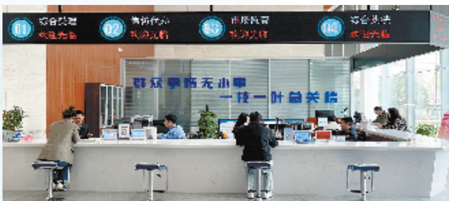
青山湖综合办事大厅