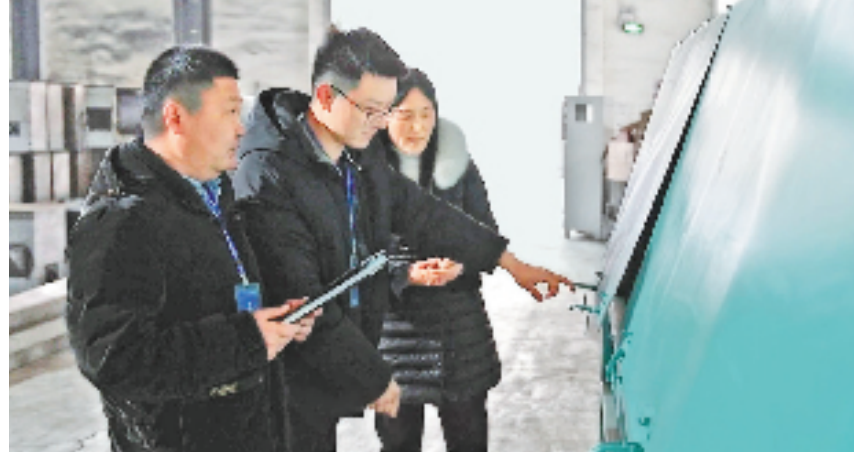
纪委工作人员现场检查企业整改情况。

紧跟着她的脚步,税务、医保、社保、公积金等窗口挨个映入眼帘。“这两年充分谋划调研的基础上,我们聚焦市场主体的堵点难点问题,督促相关