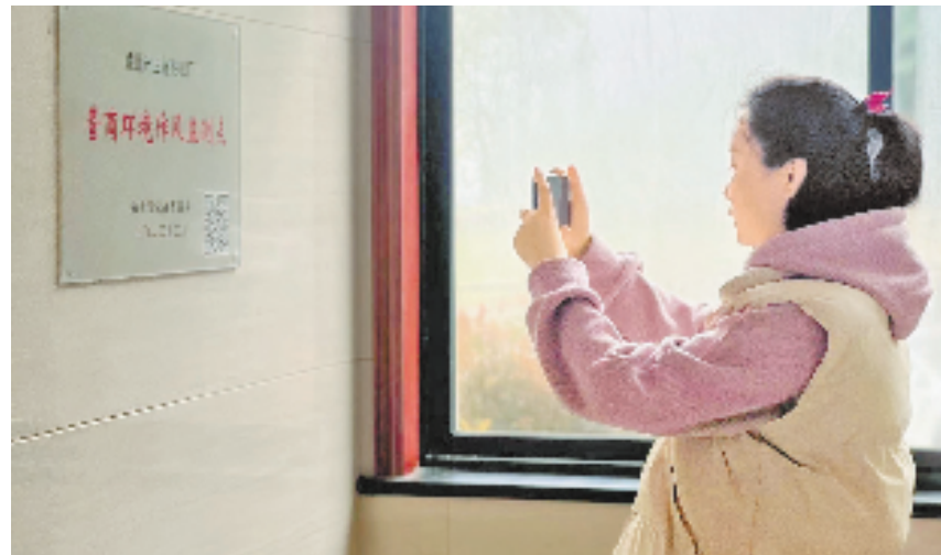
记者在营商环境作风监测点扫描“纪委书记直通码”。