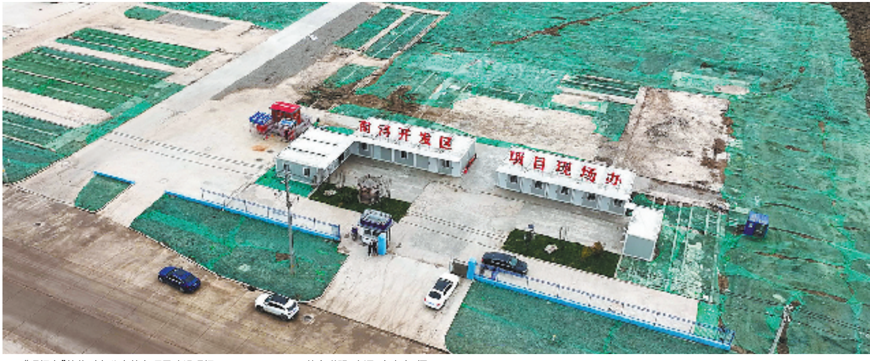
“现场办”的临时办公点就在项目建设现场。