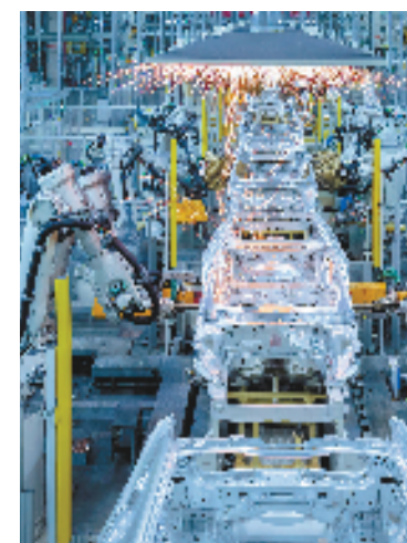
沃尔沃汽车台州工厂智能化自动焊接生产线

截至去年底，路桥区已经引进新能源汽车、GPA电驱动、新能源换电站等亿元以上产业项目15个，134个区级以上重点项目完成年度投资计划的115%；实际利用外资5814万美元，到资率居全市第一；实现外贸出口412.1亿元，增长48%，增速连续三年全市第一。