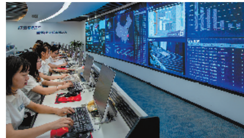
智慧工厂智控中心

桥区就新增省级未来工厂、智能工厂、数字化车间试点企业各1家，新增雄鹰企业1家，国家级专精特新“小巨人”企业7家。