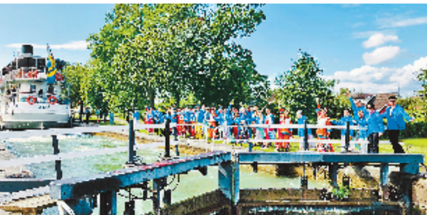
剧组在瑞典约塔运河采风。

该书是解读《世说新语》的历史随笔。全书分为“汉魏易代与始畅玄风”“竹林七贤”“中朝的浮华与梦幻”等五大章节,将魏晋时期的诸多名士放进具体的历史背景中进行解读,并展开多重线索的想象与推理,以更多元的视野来诠释魏晋时期的风流与苍凉。