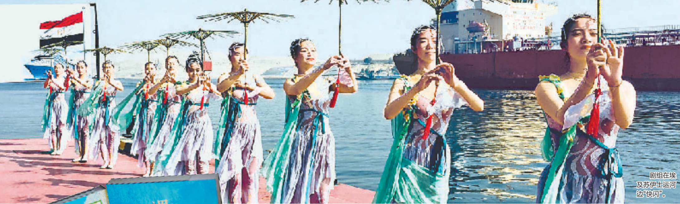
剧组在埃及苏伊士运河边“快闪”。