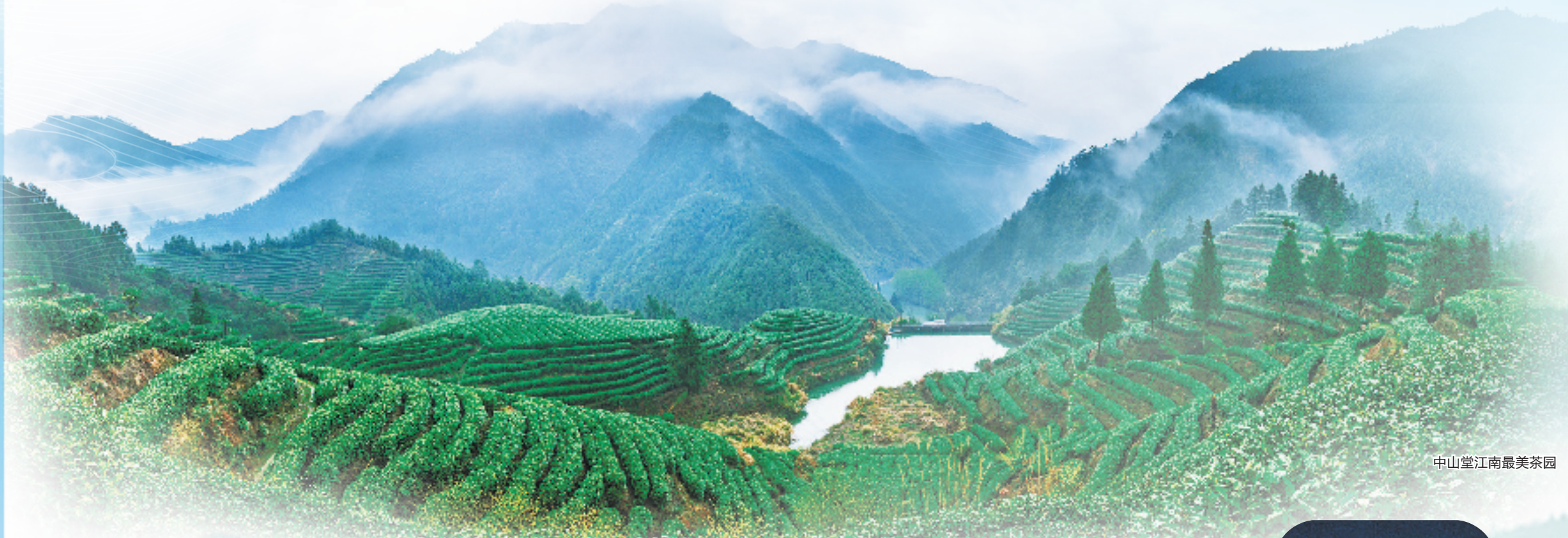
中山堂江南最美茶园

三月春风来，大龙山上绿意盎然，成片的茶园星罗棋布，嫩芽尖尖，很快，驰名中外的绿茶“开化龙顶”就要上市了。开化龙顶上市不是一件小事。在当地，每当龙顶茶进入采摘季节，人流就开始热闹起来，游山玩水，观茶品茶，吃、住、旅、购、玩，龙顶茶的故事在游客中流传，龙顶品牌在不知不觉中走向各地。