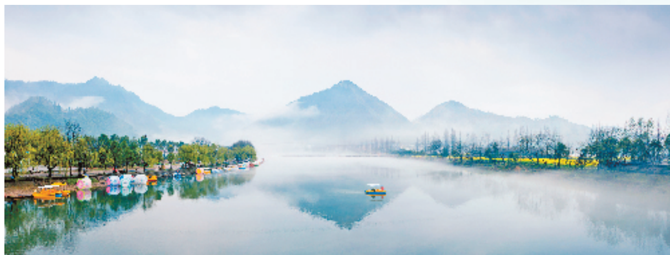
下淤水岸

在开化，像龙顶茶这样有历史、有故事、有味道的品牌农产品有很多，聚焦特色文化产品促进文旅融合的谋划也很足。东风吹醒老梅枝，在“全民共建干文旅”的火热氛围下，围绕促进全县文化旅游产业高质量发展，助推国家全域旅游示范区建设，把文化旅游产业培育成全县重要支柱产业，当下的开化，文旅融合已呈“春色满园关不住”的蓬勃态势。