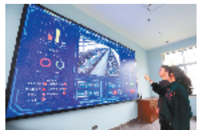
宇恒现代牧场可视化数据平台

随着“红领创客”行动的推进，截至目前，吴兴先后涌现出优秀返乡创业人才36人，新增创新创业主体23家。同时，引领和吸纳一批讲政治、眼界宽、懂经营的新生代企业家和高层次人才加入党员队伍，发挥其先锋模范作用带动效应，通过“一域创新、全域共享”在全区掀起创新创业热潮，切实助力吴兴新青年城市建设。