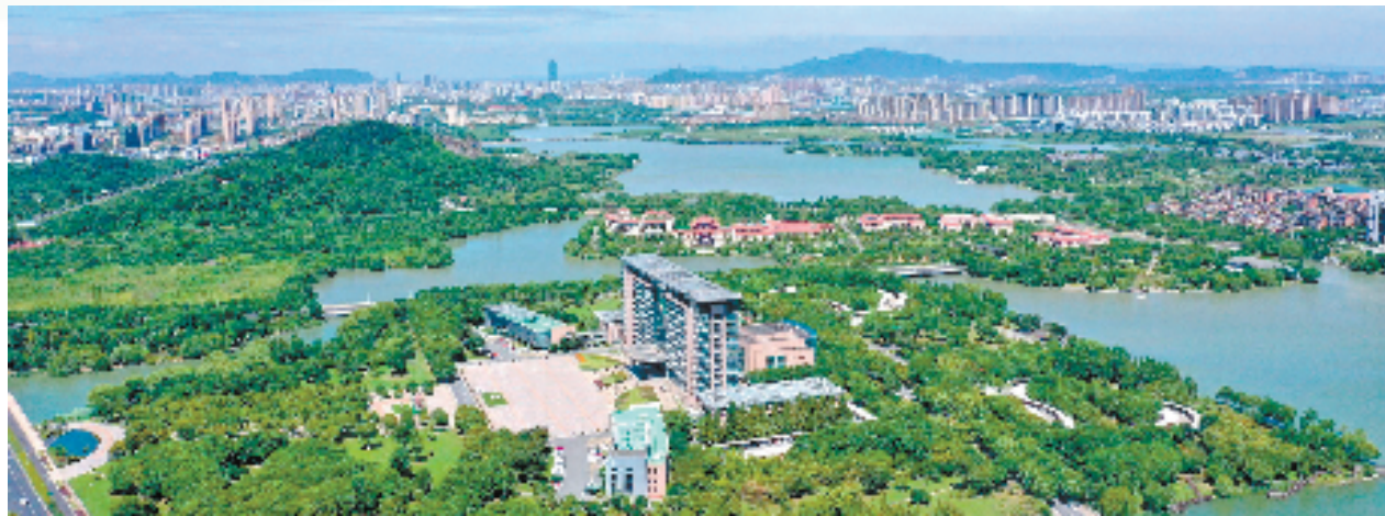
新青年之城