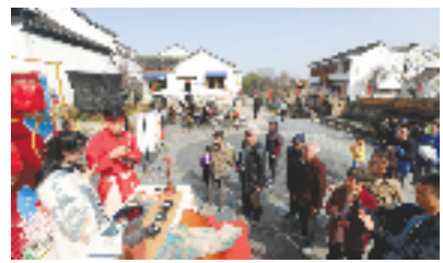
路村汉服文化节