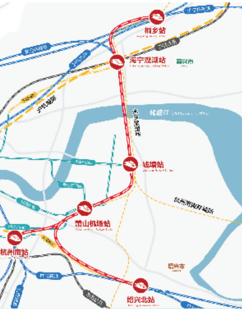
杭州机场高铁线路示意图

两年前，杭州市钱塘区正式“上新”，完成了从产业功能区到行政区的赋能升级。从单一的功能区到行政区合