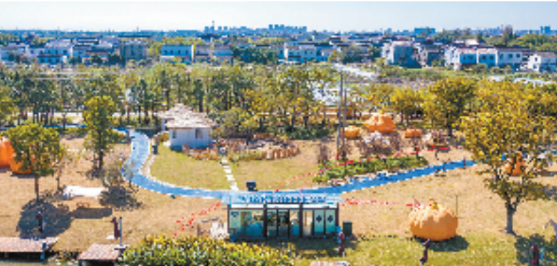
乡村咖啡馆俯瞰太湖边

沈国章是土生土长的农村人，他的家乡东华村这几年搞起了全域土地综合整治试点，随着旧产业的淘汰整治，