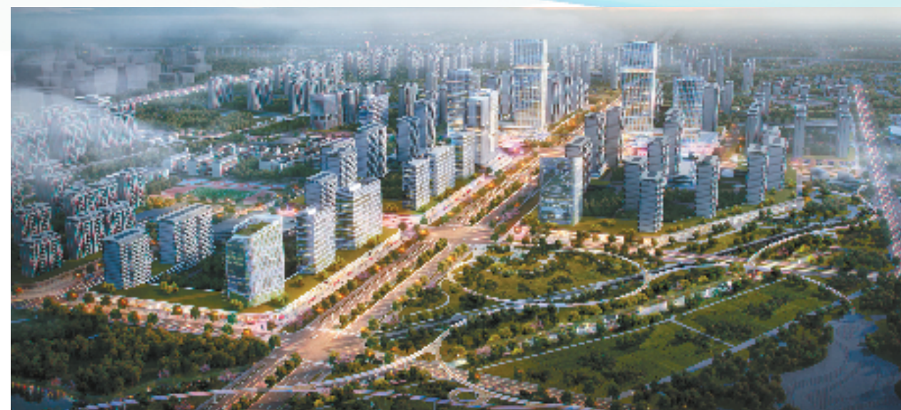
钱塘高铁新城效果图

放眼长三角，在区位上钱塘区有着“通沪、达甬、联嘉绍”的独特优势。根据《杭州铁路枢纽规划》(2016—2030年)，杭州将形成“一轴两翼”的铁路枢纽总体布局，钱塘高铁枢纽便是“一轴两翼”中的“东翼通道”——杭州机场高铁的重要站点。未来，杭州将通过高铁实现与上海虹桥机场、浦东机场的快速通达，彻底填补杭州城市东部区域没有铁路客运站空白，进一步打通钱塘轨道交通的瓶颈，从而吸引更多人才、产业等优质资源要素聚集。