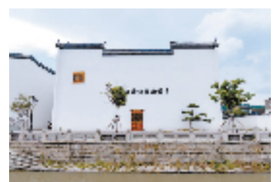
钱塘江诗词展示馆

密切结合“浙东唐诗之路+渔浦文化+乡村振兴+全域旅游”的开发方向,推动旅游与文化深度融合。春潮涌动,唯有奋进者方能勇立潮头。新的一年,义桥继续奔跑逐梦。