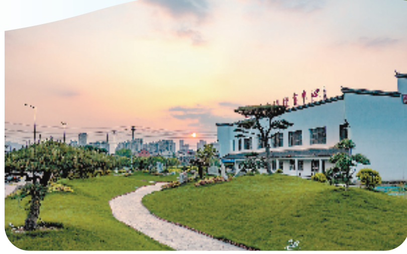
萧山区义桥镇文化体育中心