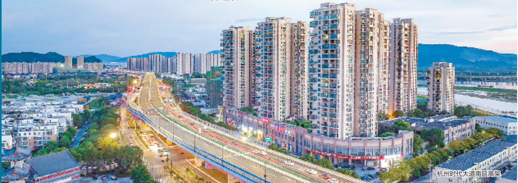
杭州时代大道南延高架