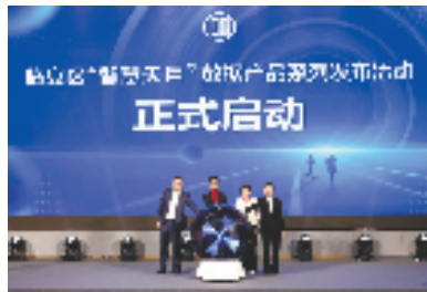
发布活动现场

踏浪前行风正劲,奋楫扬帆启新程。建设数字中国是数字时代推进中国式现代化的重要引擎,是构筑国家竞争新优势的有力支撑。“下一步,我们将聚力‘产业强区’战略导向,聚焦数字经济、数字社会、数字治理重点领