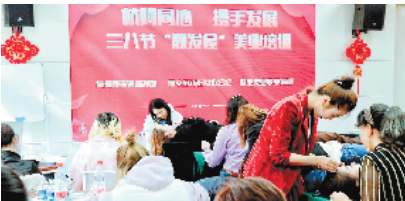
培训现场

“开创美丽事业,成就靓丽人生。我们希望通过组织赴杭免费培训、美容美发技能大赛、阿克苏‘杭州工匠’名师工作室等,建立杭阿‘靓发屋’结对帮扶机制,不断提升妇女就业创业能力,拓宽妇女就业渠道,为阿克苏妇女创业提供坚强后盾。”杭州市援疆指挥部有关负责人说道。