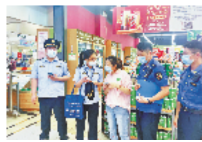
越城区通过数字化指挥平台开展“综合查一次”活动

未来，绍兴还将拓展更多应用场景，不断满足社会需求。“我们将以省‘大综合一体化’行政执法改革综合试点为契机，不断探索共建共治共享的城乡治理新模式，让管理更细、让服务更优，持续提升人民群众的获得感和满意度。”绍兴市综合行政执法局相关负责人表示。