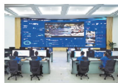
新昌县“大综合一体化”指挥大厅