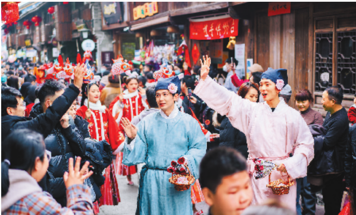
宋韵巡游活动在临海紫阳街举行。