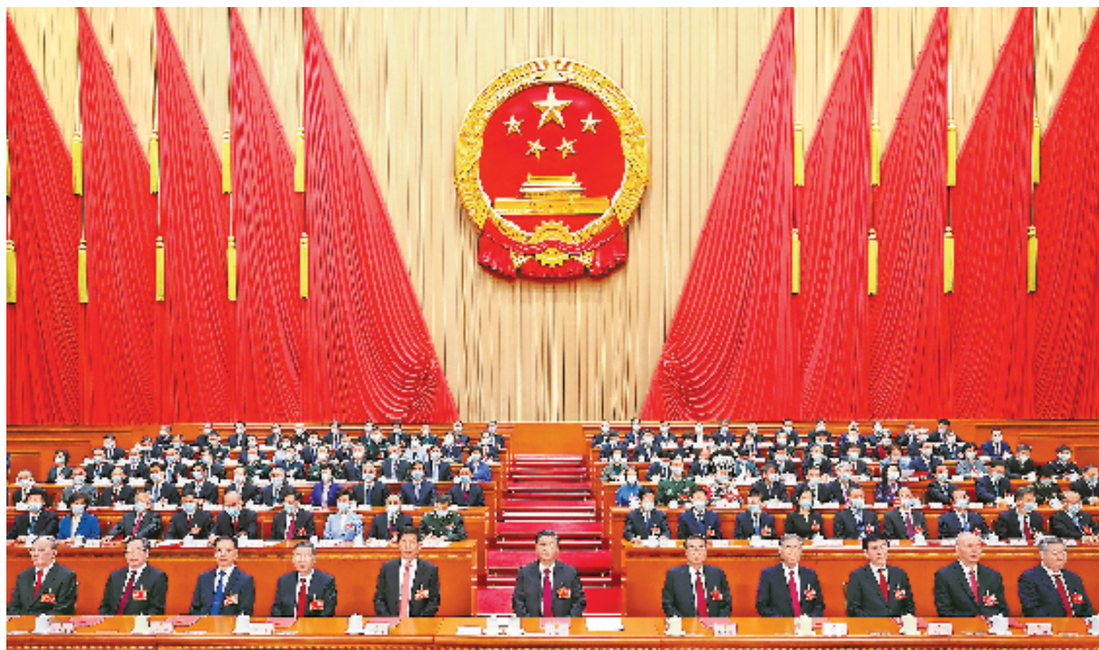
3月13日,第十四届全国人民代表大会第一次会议在北京人民大会堂闭幕。习近平等党和国家领导人在主席台就座。

新华社北京3月13日电 中华人民共和国第十四届全国人民代表大会第一次会议,在圆满完成各项议程,产生新一届国家机构组成人员后,13日上午在北京人民大会堂闭幕。