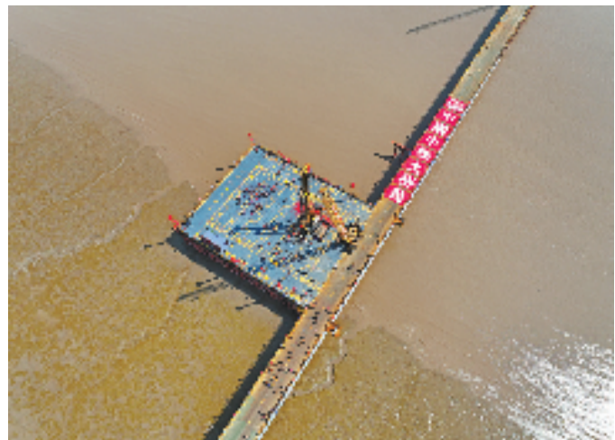
杭州湾跨海高铁大桥首桩开钻现场。