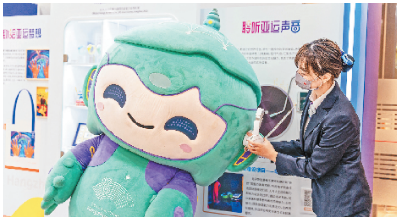
工行“亚运驿站”向市民推出“聆听亚运声音”的亚运互动体验。

工行“亚运驿站”更好地融入亚运互动体验，让市民朋友在工行营业网点就能轻松地走近亚运、聆听亚运声音。