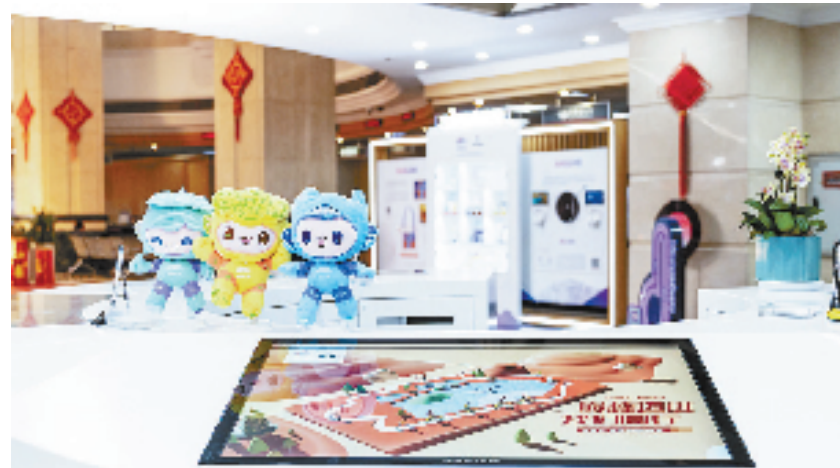
工行“亚运驿站”里亚运氛围感拉满

如今，焕然一新的工行“亚运驿站”让更多人能够了解亚运会的“前世今生”、感受亚运会令人振奋的体育精神。未来的日子里，工行将继续以“亚运梦”为翅膀，让更多市民走进工行、走近亚运，尽享“亚运时刻”。