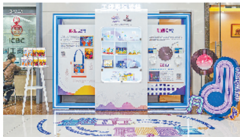
与亚运结缘，工行“亚运驿站”搭建更加多元化服务生态。