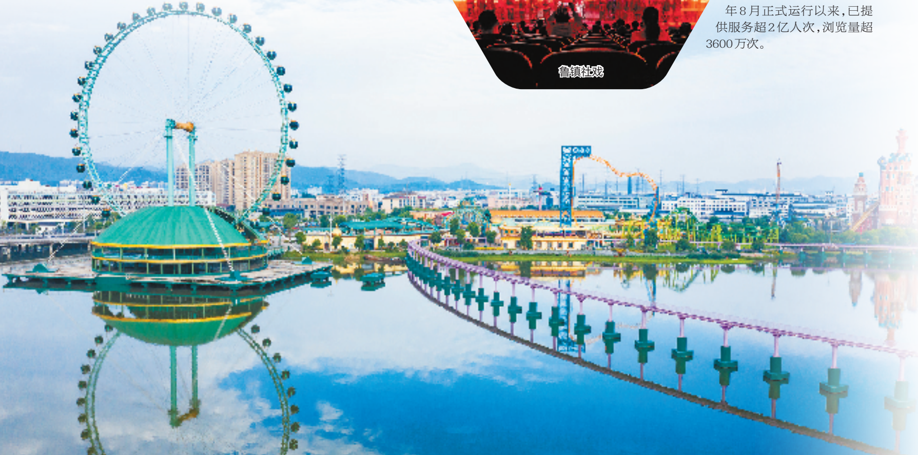
东方山水 酷玩王国