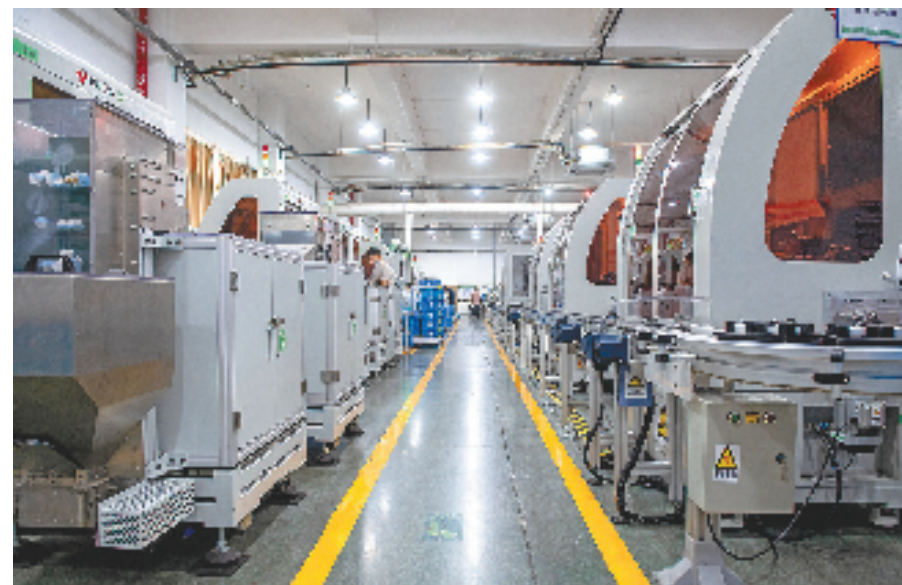
公牛集团生产车间