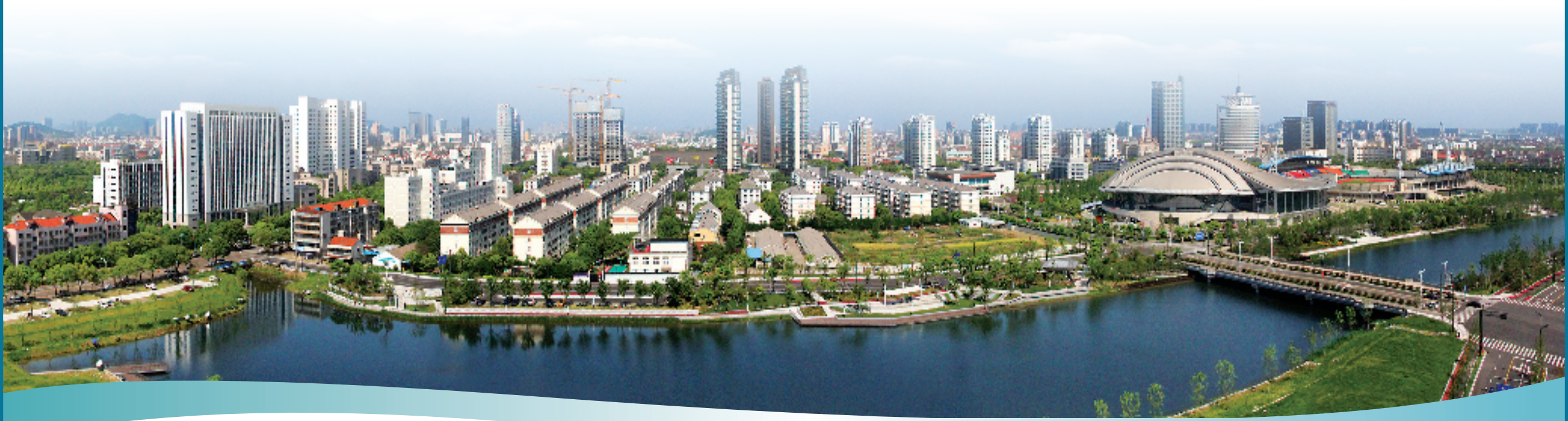
慈溪城市建设日新月异

县域现代化,产业的现代化转型是重大命题。在实体经济重镇宁波慈溪,一场蓄力已久的制造业变革如火如荼开展。围绕当地工业经济发展的局限、短板,慈溪以时不我待的改革攻坚勇气,打出龙头企业培育、块状产业治理、工业用地改革等系列组合拳,全方位、多层次推进产业提质、城市提能。春已至,再出发。瞄准打造现代化滨海大都市北部智造名城这个目标方位,启动实施智造强市、改革创新等八项“大提升工程”,慈溪以制造业高质量发展为主线,奋力拼经济!