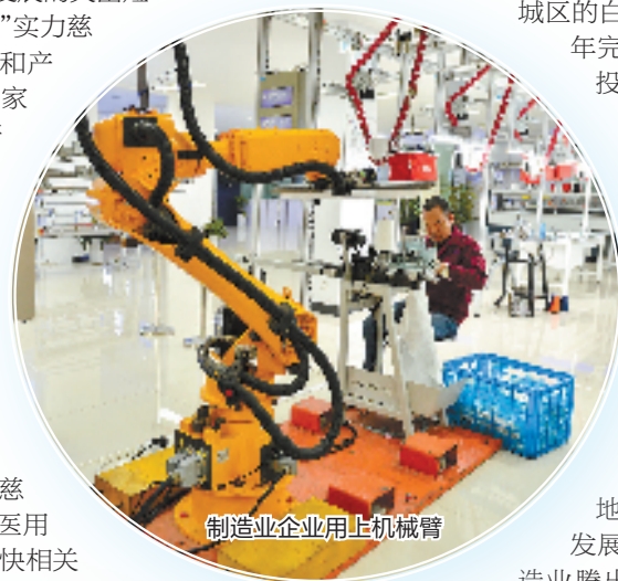
制造业企业用上机械臂

截至去年底,慈溪累计拥有国家级制造业单项冠军企业5家,国家专精特新“小巨人”企业34家。到2025年,该市力争国家级制造业单项冠军企业数达到8家,国家级专精特新“小巨人”数量达50家。