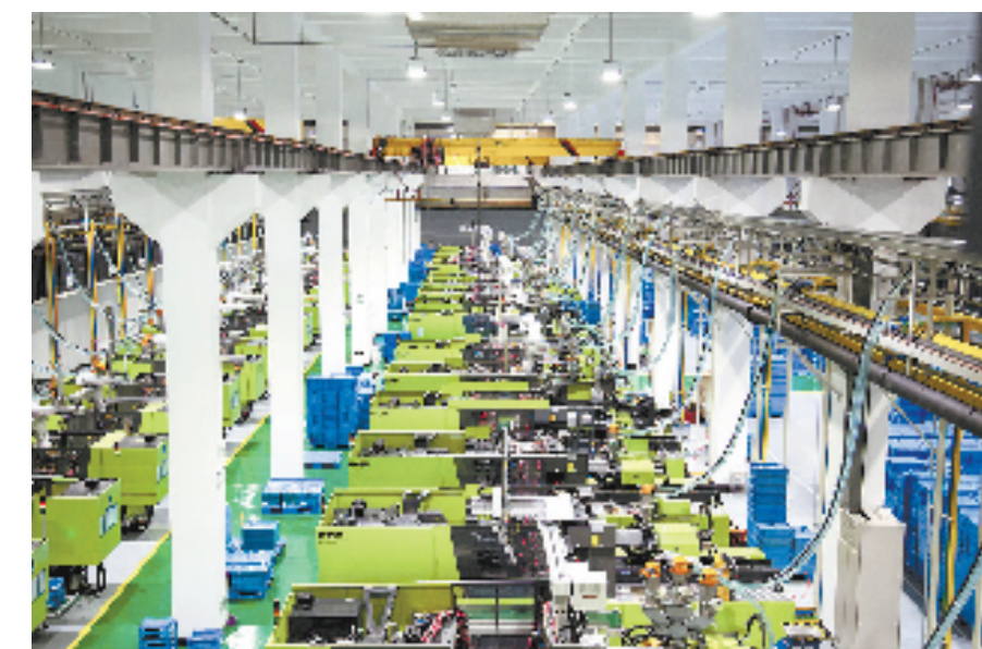
企业的现代化车间