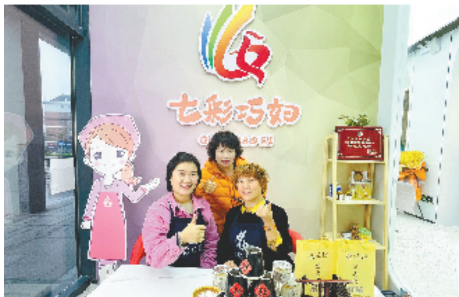
“七彩巧妇”带动村民增收致富