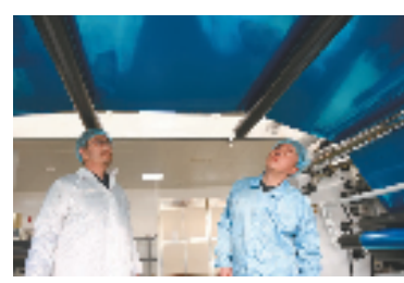
宁波瑞凌新能源科技有限公司内,工人在降温薄膜自动化生产车间监测设备运行情况。

来,奉化还通过补齐高品质教育、医疗、养老、育幼等公共服务短板,系统优化公共服务,提升城市软实力。未来,奉化将继续以打造一流营商环境赋能高质量发展,努力开创中国式现代化奉化实践的崭新局面。