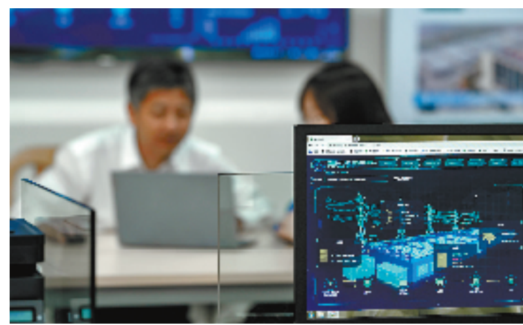
全省首个智慧光伏一体化服务分中心在奉化投用

“对于高新技术产业投资项目,我们将持续抓好推进并督促相关企业尽量按计划进度推进,跟踪关注重大项目建设的投资进度。”奉化区科技局相关负责人表示。