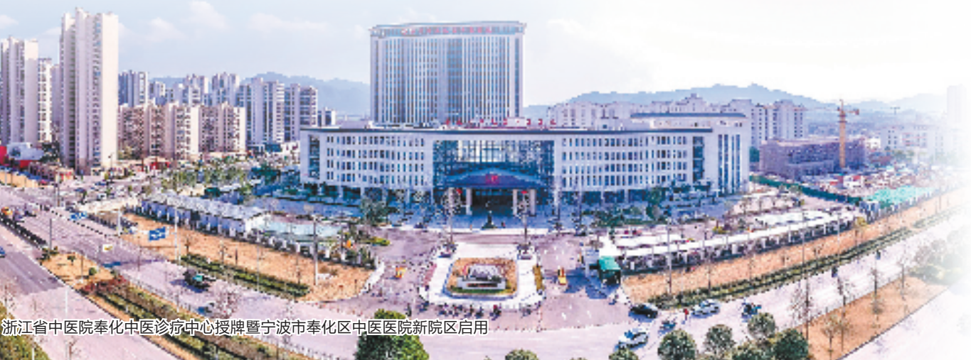
浙江省中医院奉化中医诊疗中心授牌暨宁波市奉化区中医院新院区启用