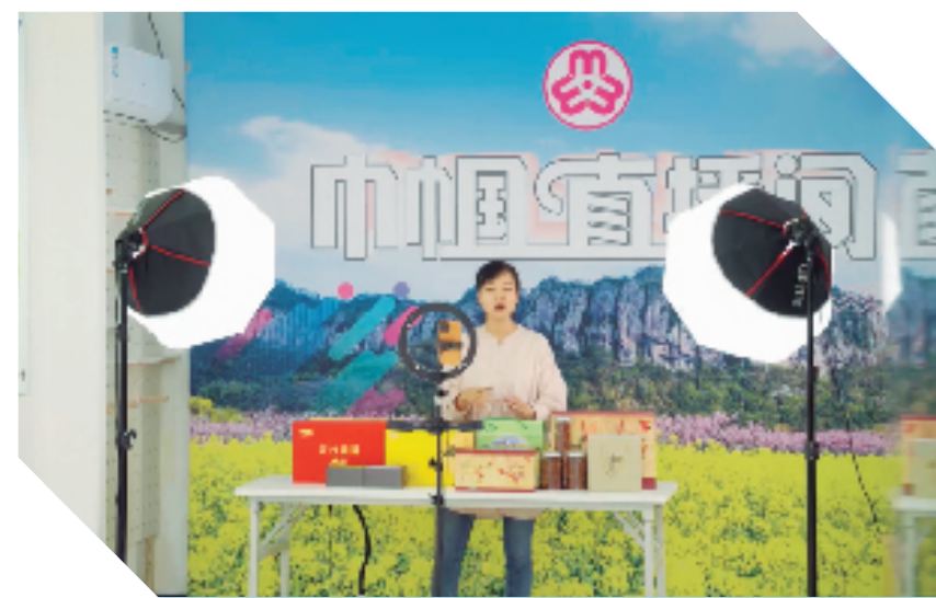
浙江移动助力天台后岸村成为全省首批未来乡村，建设5G网络、千兆宽带支撑“农民主播团”线上土货销售。

目前，由浙江移动主导建设的数字化改革项目达500余个，协助沉淀理论成果28项，2022年度104项省级数字化改革“最佳应用”项目中浙江参与的占61个，数字化改革15项最强大脑项目中浙江移动参与达到10个，有力推动了政府社会治理和民生服务数字化水平持续提升。