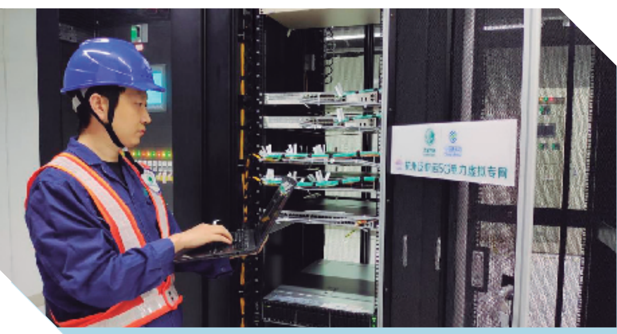
浙江移动支持建设5G电力虚拟专网，赋能杭州亚运全绿电零碳示范区。