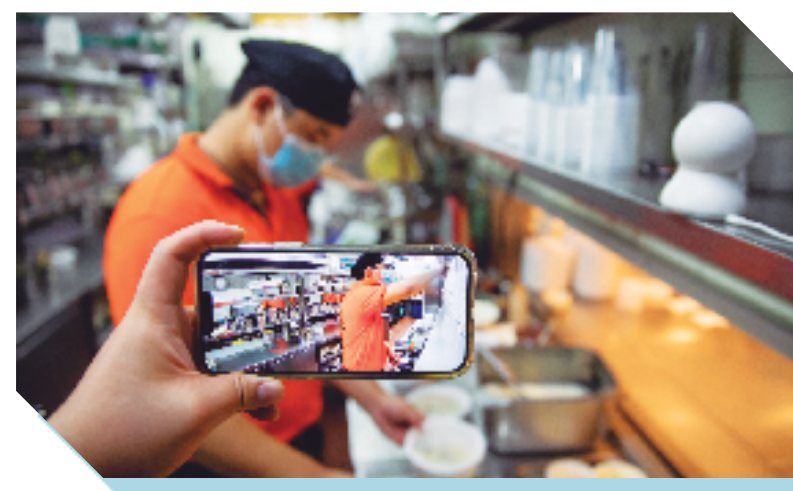
浙江移动助力打造“阳光厨房”平台，人们可以通过外卖平台内店家的“阳光厨房”端口进入观看直播。