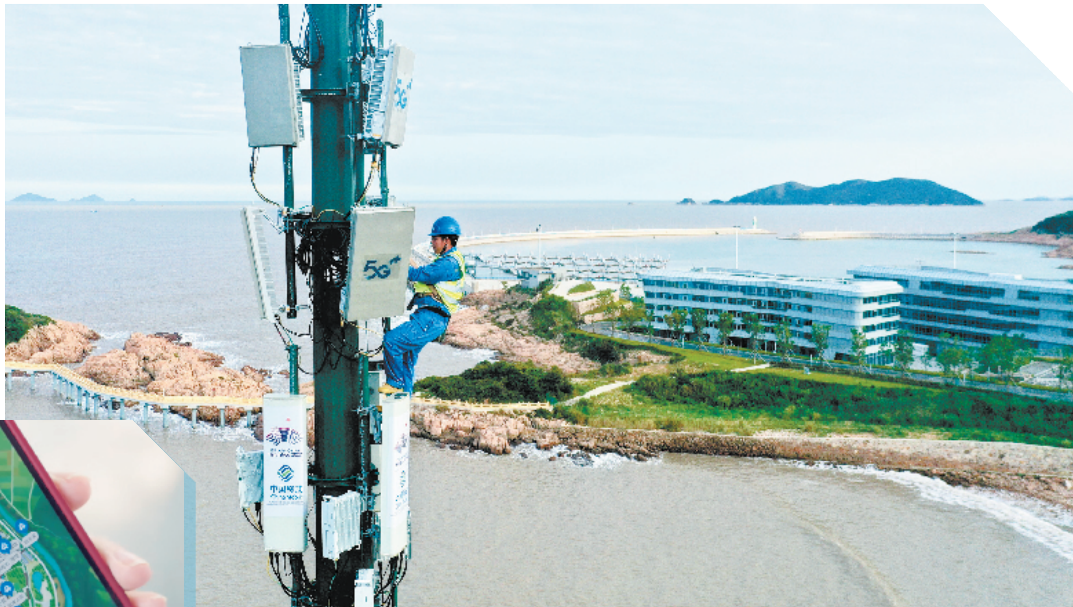
浙江移动5G基站遍布省内，数量达10.5万个。

“发展数字经济，基础通信运营企业是中坚力量。中国移动浙江公司锚定建立‘世界一流信息服务科技创新公司’目标，全面发力‘两个新型’，打造以5G、算力网络、能力中台为重点的新型信息基础设施，创新构建‘连接+算力+能力’新型信息服务体系，积极融入浙江省奋力推进‘两个先行’的发展大局，全面助力数字经济做大做强。”中国移动浙江公司党委书记、董事长、总经理杨剑宇说。