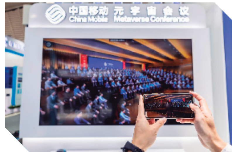
2022年世界互联网大会，浙江移动展厅举行了一场“元宇宙会议”。

为了进一步赋能乡村基层治理、健康医疗、教育文化，浙江移动深化数智化工程，集成党建引领、村务公开以及家宴预定等35项标准化应用，提供乡村基层治理信息化解决方案，打造数字化平台赋能我省3000余个行政村，以5G为支撑的信息化建设成为乡村振兴的重要力量。