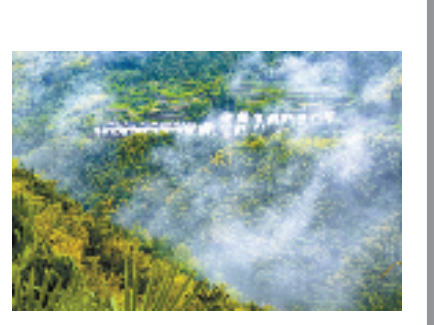
磐安县三亩田村

续以“八八八”为导向,立足环境、设施、体验、服务、运营五个维度,深入推进旅游业“微改造、精提升”,推动当地文化和旅游深度融合高质量发展,努力为磐安县推进共同富裕注入源源不断的动能。