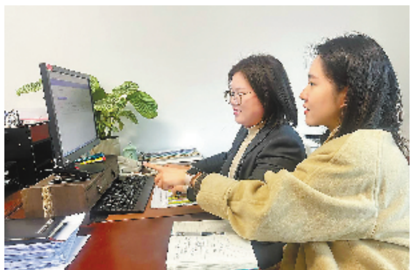
本报记者(右)和临平企服中心诉求办理助理助企服务员一起整理企业反映的诉求。