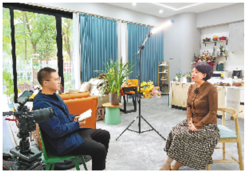
本报记者(左)走进浙江省羊毛衫协会副会长“毛衣姐姐”的直播间,聆听她带着商户学直播带货的故事。