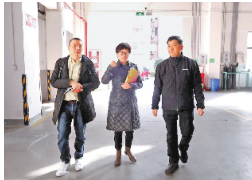
本报记者(左)蹲点采访宁波励辉电器有限公司。