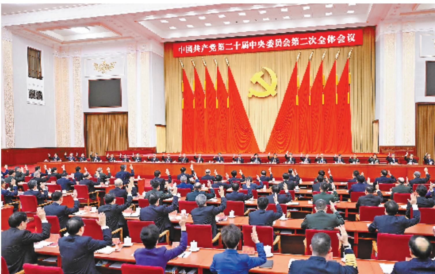
中国共产党第二十届中央委员会第二次全体会议,于2023年2月26日至28日在北京举行。中央政治局主持会议。