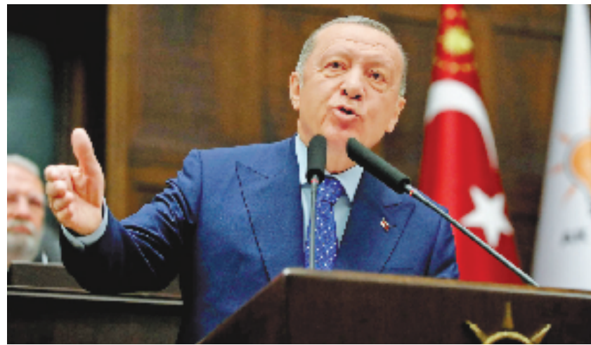
土耳其总统埃尔多安(资料照片)。