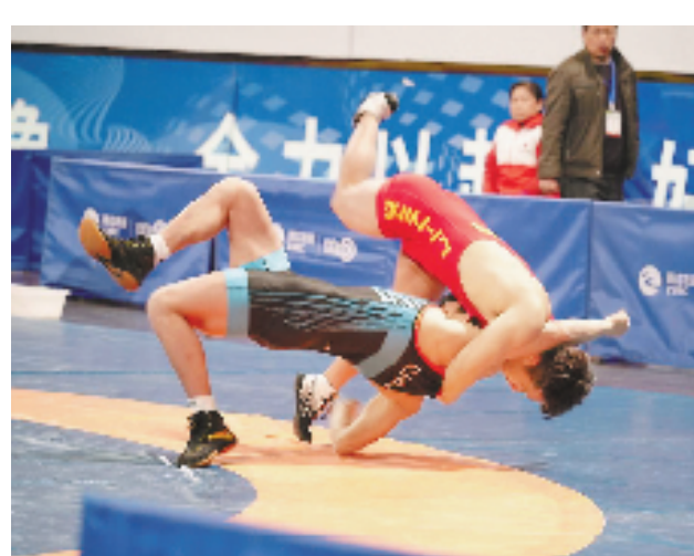
2月20日，浙江省青少年摔跤、柔道锦标赛在兰溪市体育中心开幕。比赛由省体育局主办、兰溪市政府承办，吸引来自全省各设区市的9支柔道代表队、13支摔跤代表队，共计335名运动员参加。

舟山税务部门还以“网格化管理、组团式服务”为抓手，推出“一企一策”“专户专员”的“项目管家”服务，为特色项目、重点项目选派“税企服务员”，提供全方位政策指引、纳税辅导、综合分析等服务，确保重点项目顺利推进，新年以来助推招商引资“一号工程”落地提速25%以上。