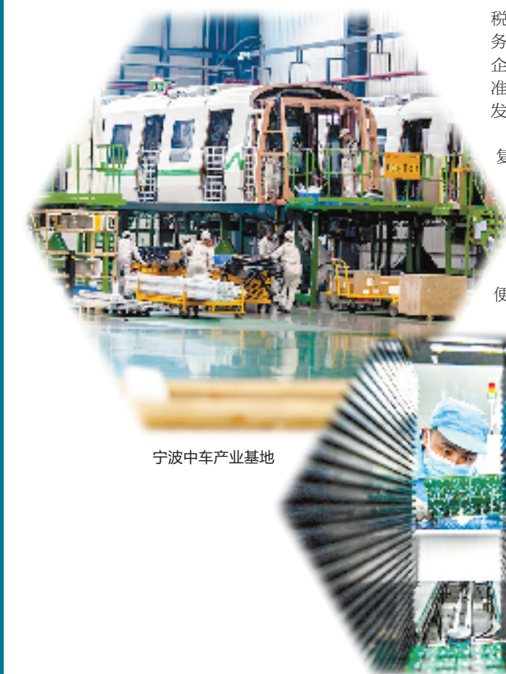
宁波中车产业基地

百舸争流，奋楫者先。鄞州大地上，创新的澎湃动力，正浇灌出“乔木”参天、“灌木”茁壮、“苗圃”葱郁的“森林”。