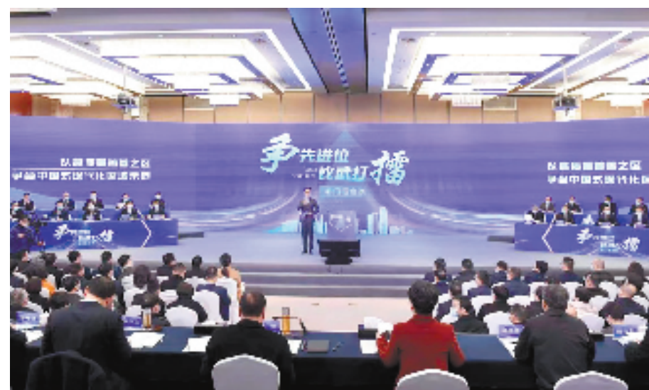
2023鄞州区“争先进位·比武打擂”活动

营商环境，“优”无止境。鄞州正以优化营商环境为“源头活水”，激活区域高质量发展的“一池春水”。