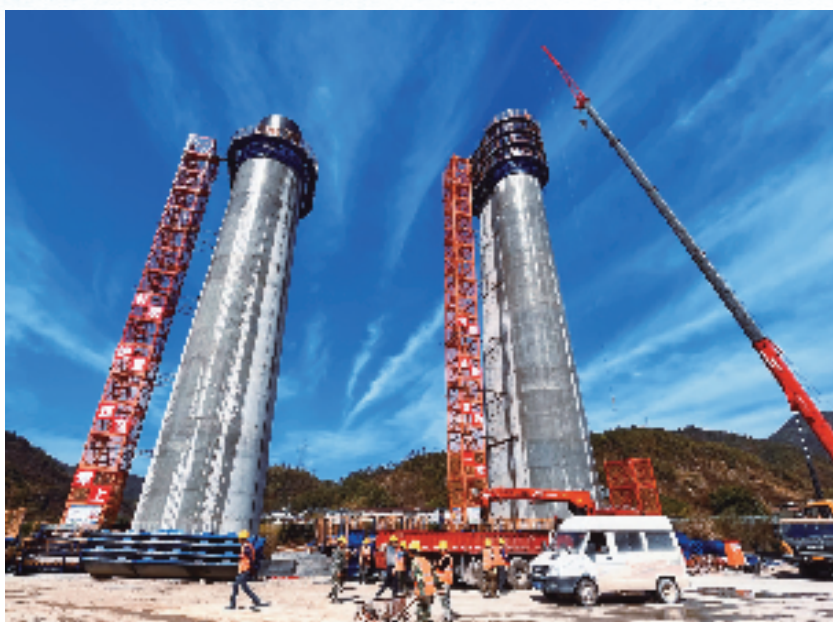
衢丽铁路小安溪特大桥施工现场

衢丽铁路全线建成通车后，届时从衢州乘坐火车到丽水不到1小时，无需再绕行金华，原本近1.5小时的车程将缩短约40%。华中、西南地区经衢州与丽水、温州地区间的便捷运输通道也将彻底打通，有助于完善浙西南路网布局，打造浙江省“大花园”美丽通道，对推进山区26县跨越式高质量发展、助力建设共同富裕示范区等方面具有重要意义。