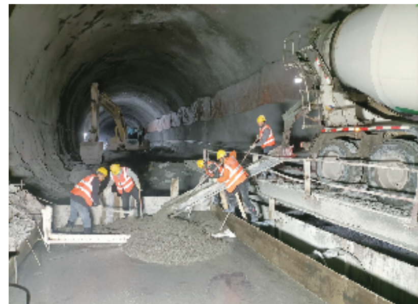
丽阳山隧道进口施工现场，工人正在进行仰拱混凝土浇筑作业。