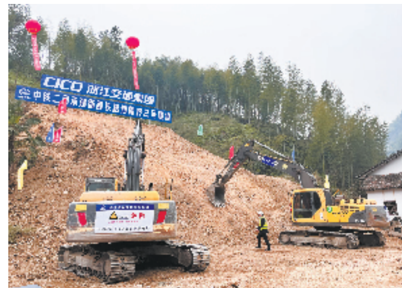
衢丽铁路(衢州至松阳段)正式开工

战鼓擂响，号角催征。除了衢丽铁路，在之江大地延绵的轨道上，热火朝天的景象如春日暖阳般充满生机与希望：塔吊林立、机器轰鸣……省交通集团主导投资建设的杭温铁路二期、金建铁路、瑞苍高速、杭绍甬高速杭绍段等一批项目正以强劲开局确保全年投资建设目标任务的圆满完成。