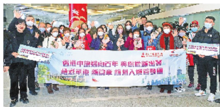
香港入境旅游团抵达杭州。

当晚,杭州市文广旅游局、上城区文广旅体局、中国国旅浙江公司相关负责人组成接机团,为香港游客一行送上鲜花和伴手礼——新年吉祥物“兔爷”和亚运明信片。“不出正月还是年,我们希望送上一片心意表达杭州的诚挚欢迎,祝福香港游客兔年吉祥平安,也通过亚运纪念品让他们提前感受杭州亚运盛会的别样精彩。”中国国旅浙江公司相关负责人说。