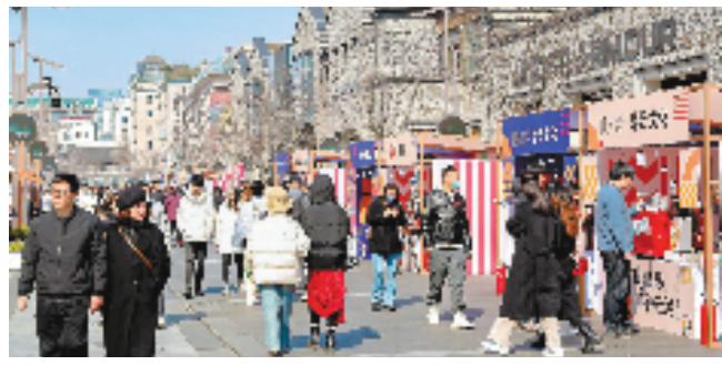
2月14日,市民、游客在杭州湖滨步行街体验新春“赶潮”季。本报记者 姚颖康 摄影 李凌婧 摄

本报杭州2月14日讯(记者 全琳琳 张梦月 通讯员 毛连城 余慧芳)时尚秀、Live演奏、市集、车展……14日晚,杭州湖滨步行街人声鼎沸。杭州市政府和省商务厅共同主办的“浙里来消费·2023消费提振年”行动暨欢购上城新春“赶潮”季在此启动。 行动计划聚焦“全年乐享,全民盛惠”主题,以“浙里来消费”为主线,坚持“品牌共建共享、资源赋能加持、载体联创联动”,实施培育热点扩增量、创新场景拓市场、树立品牌优品质、提升主体强活力、助销26县促共富等五大行动。 省商务厅相关负责人表示,全年争取省市县三级联动举办促消费活动1000场以上,形成“季季有主题、月月有展会、周周有场景”的促消费活动态势。