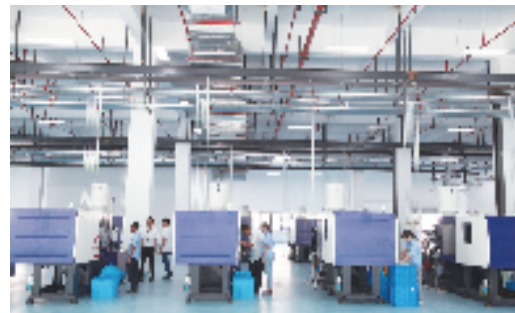
丽景民族工业园智能化车间