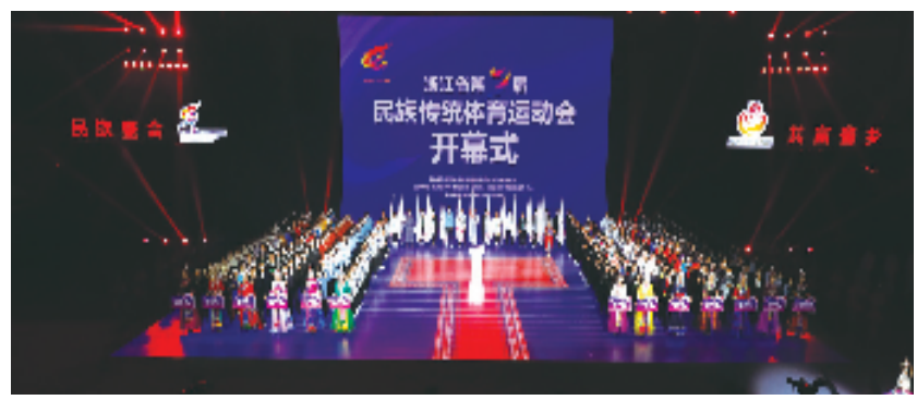
浙江省第七届民族传统体育运动会开幕式