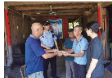
法院执行干警为申请执行人送执行款上门

民生所盼,政之所向。景宁以发展之“拼”保障民生之“优”,不断提升城乡发展品质、优化城乡发展环境、提升民生服务温度。过去一年,景宁统筹推进经济发展和民生保障,在医疗、养老、乡村振兴等领域持续增进民生福祉,2022年度十件民生实事全面完成,人民群众获得感、幸福感、安全感全面提升。