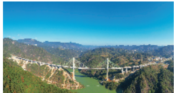
景文高速高岭头水库大桥