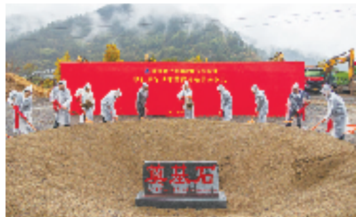
景宁抽水蓄能电站开工奠基