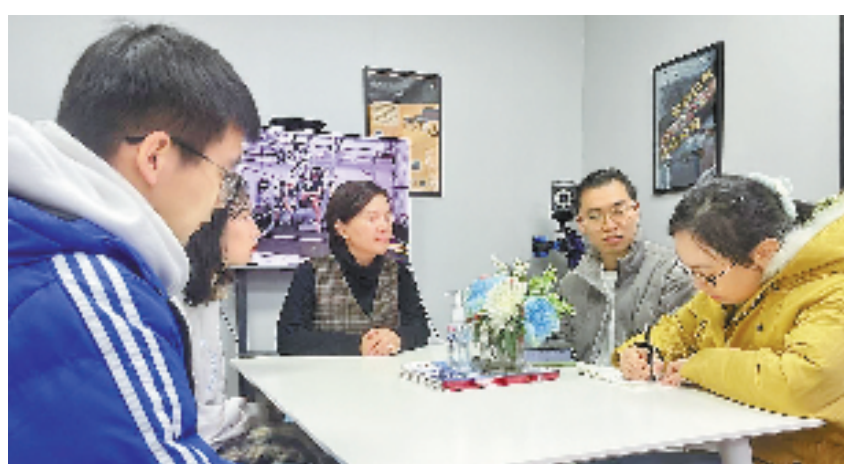
本报记者(右一)蹲点采访和丰-诺丁汉创新设计实验室。

国内是科研的热土,这是许多采访对象都提到的一句话。从他们充满激情的表达中,我们仿佛看到每一点梦想的星火,都在这里汇聚成时代的