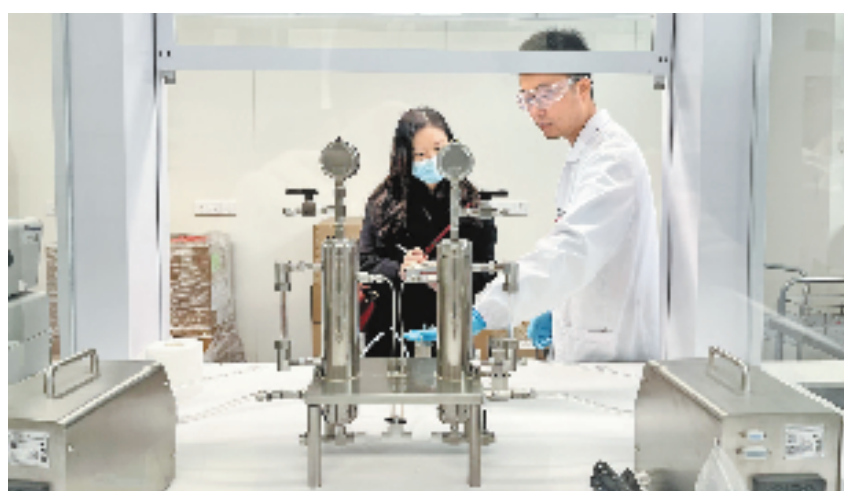
本报记者(左)和西湖大学科研人员。

“让更多世界级成果出自中国的实验室。”“西湖大学是一所‘小而精’的大学,但这并不影响其成为‘大’。”