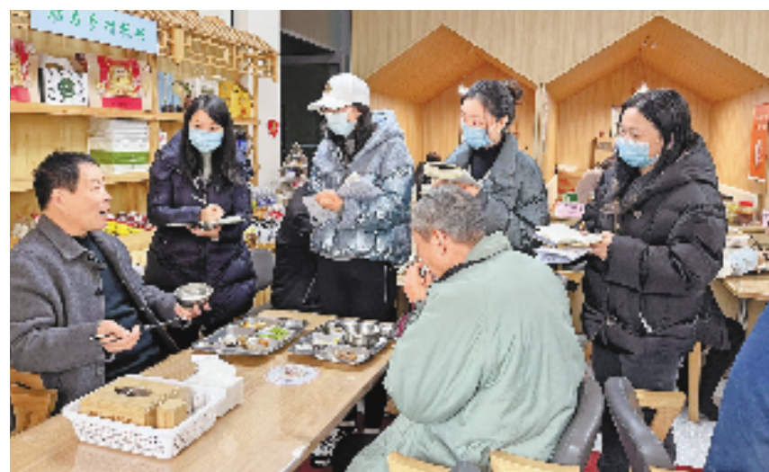
枫桥学院教师和记者(右一、右二)在诸暨市浣东街道东盛社区共享食堂调研。

浣东街道东盛社区是诸暨首个共享社区。所谓共享社区,社区党总支书记王杜芳的理解是:“共享社区,其实就是