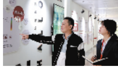
宁波银行金华分行客户经理走访企业

“支持实体经济特别是中小微企业是我们的职责所在。新年伊始，我们的工作重点就是全力帮助企业提振信心，