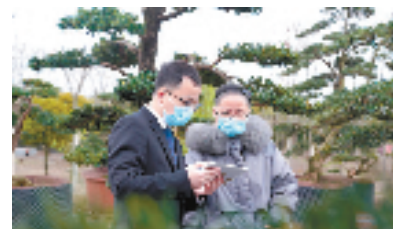
泰隆银行金华分行开展新春大走访活动

助力经济‘开门红’。”以新春走访为契机，泰隆银行主动为企业问诊把脉、当好参谋，通过专业、精准、高效的“融智”