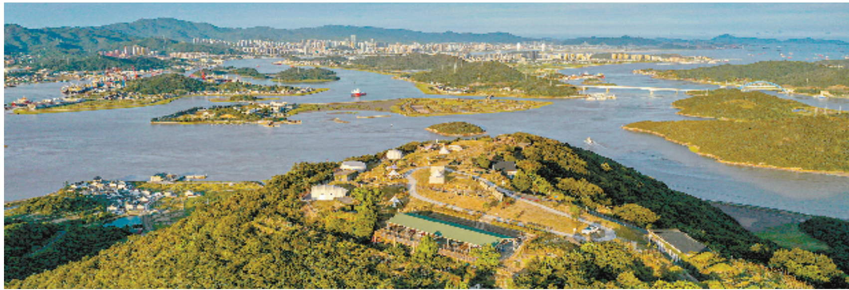
东岙岛全貌

近年来，定海海洋农商银行积极探索“一岛一策”的金融服务方案，围绕“小岛你好”——海岛共富行动等，聚焦辖区小岛风貌综合整治、基础设施提升、产业更新、集体经济壮大等建设重点，已累计提供相关信贷资金5500万元。