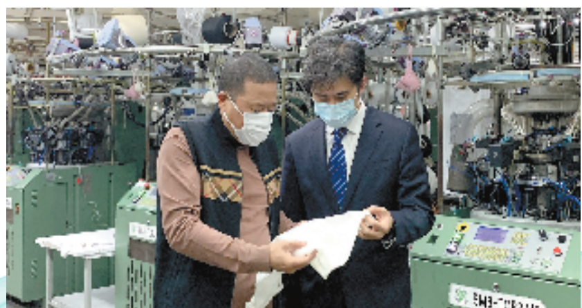
工行义乌分行客户经理走访企业

金华市某工具有限公司主营电仪器仪表制造和销售，今年1月接到一批新订单，企业亟须采购原材料，但贷款暂未回笼，急缺流动资金。宁波银行金华分行充分考虑企业需求，为其线上申请“容易贷”产品，提供资金支持90万元。针对贷款临近到期，但仍有融资需求的小微企业，该行用好无还本续贷产品“转贷融”，帮助企业有效缓解还款压力，为企业持续经营发展注入金融动力。