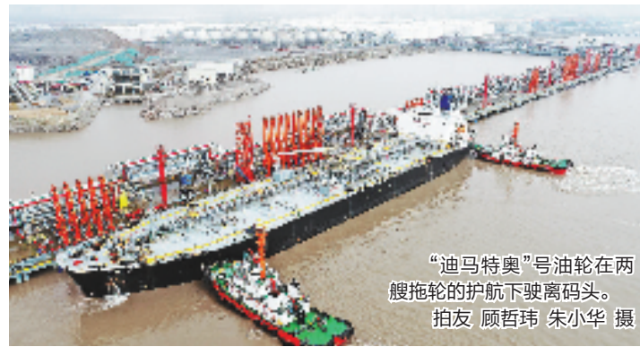
“迪马特奥”号油轮在两艘拖轮的护航下驶离码头。

本报舟山2月12日电（记者 拜喆喆 黄宁璐 通讯员 朱小华）12日下午，装载浙石化生产的4万吨航空煤油的新加坡籍“迪马特奥”号油轮通过海关监管，缓缓驶离浙石化6号泊位，前往孟加拉国。这是浙江自贸试验区舟山片区首次出口航空煤油。 航空煤油是浙江自贸试验区油气产业链布局中的重要组成部分，此次顺利出口，将使自贸试验区的油气产业链更加完善。 据悉，随着4000万吨/年炼化一体化项目二期全面投产，浙石化的原油加工能力不断提高，油品、化工品产能大大提升，仅航空煤油一项，目前已具备26万吨/月至30万吨/月产能。