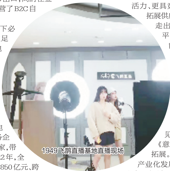
1949飞鹤直播基地直播现场

全国首个全球速卖通电商园; 艺尚小镇、云裳城、谋立方、遥望数字化服装采购产业基地、1949飞鹤直播基地等直播电商产业空间总面积超50万平方米……立足“融沪桥头堡、未来智造城、品质新城区”的战略定位和“数智临平、品质城区”的发展定位, 锚定新电商产业发展标杆区, 临平敢为人先, 为中国式现代化浙江篇章的谱写贡献应有的力量。