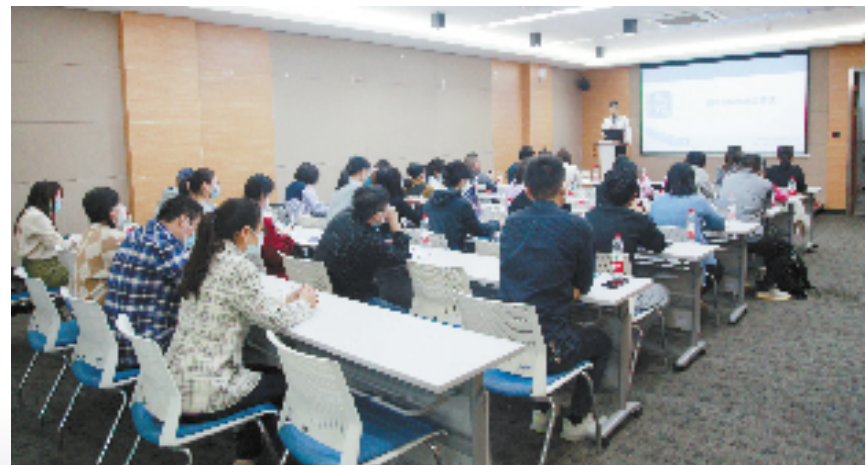
临平区电商政策解读培训活动现场