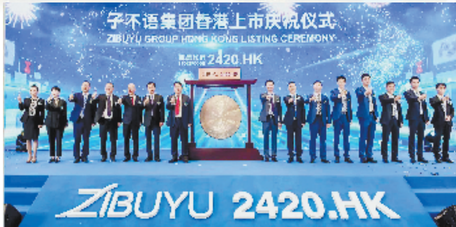
子不语集团香港上市敲钟现场

让人眼前一亮的, 是标杆企业的崛起成为临平新电商的一大特征。除了上市企业接连涌现外, 构美、鸭梨互动、博观瑞思3家抖音官方认证钻石级服务商落户于此; 集聚了谋事文化、锦溪文化等头部直播机构; 涌现出空刻、嗨喜、海泊、伯喜、范思等明星直播企业; 跨境电商集群培育出子不语、森帛服饰、云端进出口、杰西亚家居、宠恒、益加益等年出口额千万美元以上企业22家; “阿里巴巴临平跨境电商专区”开通店铺超千家……临平已成为杭州新电商发展的一片高质量发展沃土。