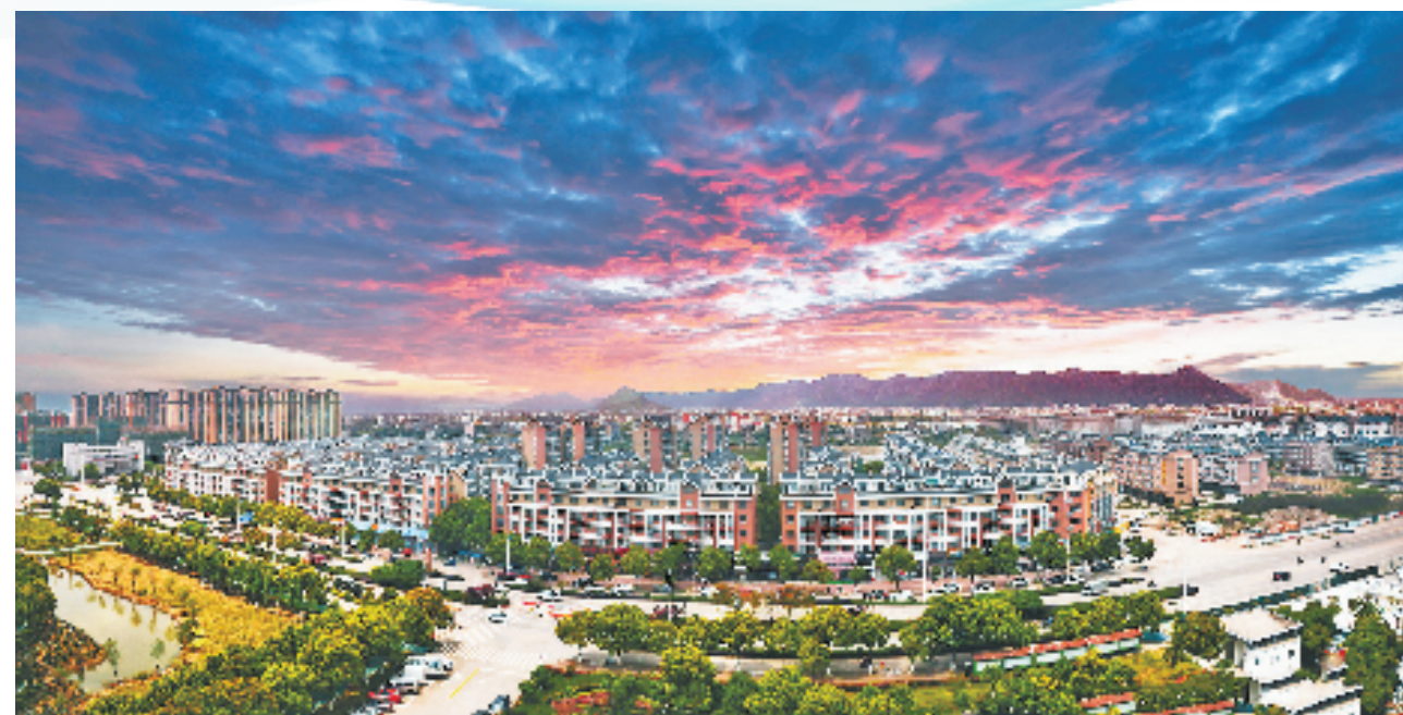
箬横镇南城新城

一座三角桥，横跨三河道；两行亲水亭，点影水上漂……在温岭市箬横镇，汇头林村，不少游客在乡贤三角亭桥小憩，既能观赏千米亲水漫步道上的靓丽风景，也能凭栏远眺，感受满满的乡愁。推窗见绿，出门见景。箬横镇以生