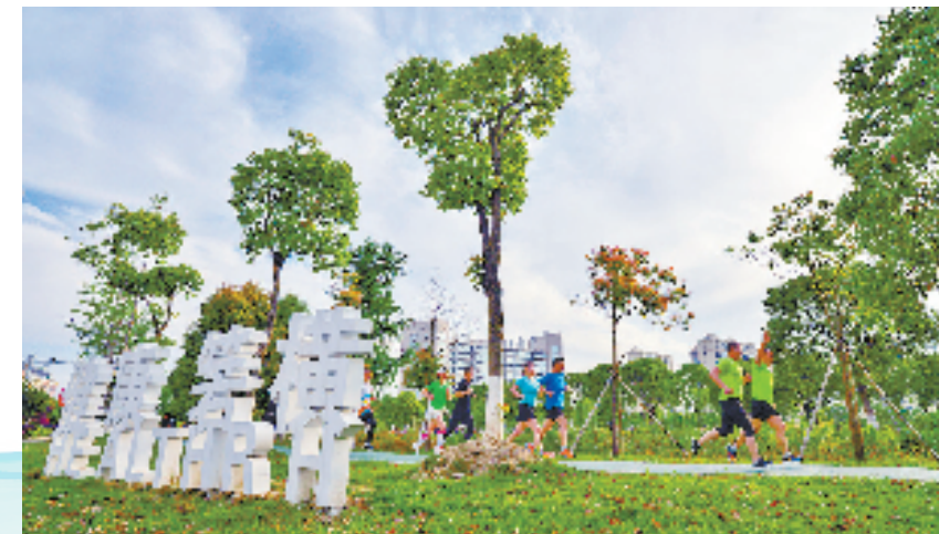
市民在箬横镇健康主题公园晨跑锻炼

佳讯频频。日前，箬横镇迎来工业用地出让项目“开门红”，合约134.177亩的两地块由浙江岭德重工有限公司竞得，建成投产后，年产值可达20亿元