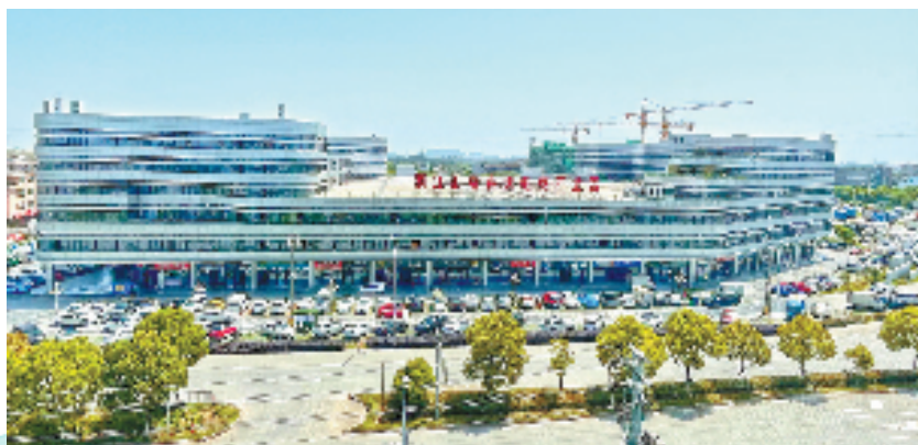
汇富春天电商产业园

从股份合作制企业发源地到做大产业集群，从城镇统筹发展到功能品质服务全面提升，再到建设“韵味水乡、工贸强镇、品质新城”。泽国的每一次“进阶”，都有着变革和创新的影子。