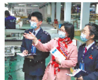
国家税务总局余姚市税务局青年“税收顾问”为企业送上“税收政策”大礼包。

“目前,在国家税务总局统一部署下,宁波‘便民办税春风行动’已经推出首批17条举措,我们将继续做好深化、提升、拓展‘文章’,让‘春风’力度更大、‘温度’更暖。”国家税务总局宁波市税务局相关负责人说。