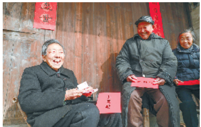
南浔区千金镇东驿达村老人收到了新年慰问红包

“一老一小”,尤其是留守老人和留守儿童,更应该得到全社会的关爱和重视。”千金镇相关负责人表示,接下来,该镇将继续发挥党建共建、村社服务小分队等作用,着力构建“一老一小”幸福生活圈,为他们托起稳稳的幸福。