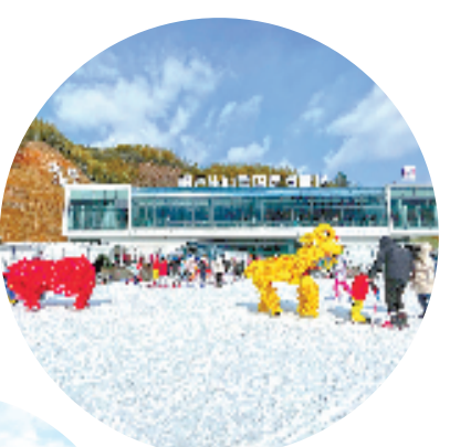
桐庐生仙里国际滑雪场

益沉得下来、让文化传得开来的良性互动、多方共赢的崭新格局。”桐庐县文广旅体局相关负责人说。