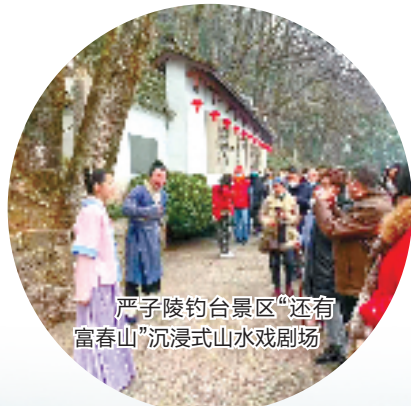
严子陵钓台景区“还有富春山”沉浸式山水戏剧场

战鼓声声催人早，砥砺奋进正当时。2023年是杭州亚运会召开之年，也是全面实施“十四五”规划承上启下的关键之年。桐庐县文广旅体局将以打造“长三角最佳短途旅游目的地”为目标，借势“杭州文旅西进”战略和“三江两岸”水上黄金游国际文旅名片打造，聚焦“产业升级、亚运马术、文化繁荣”等重点工作，全方位推进文旅体深度融合，努力实现文旅体产业跨越式发展。