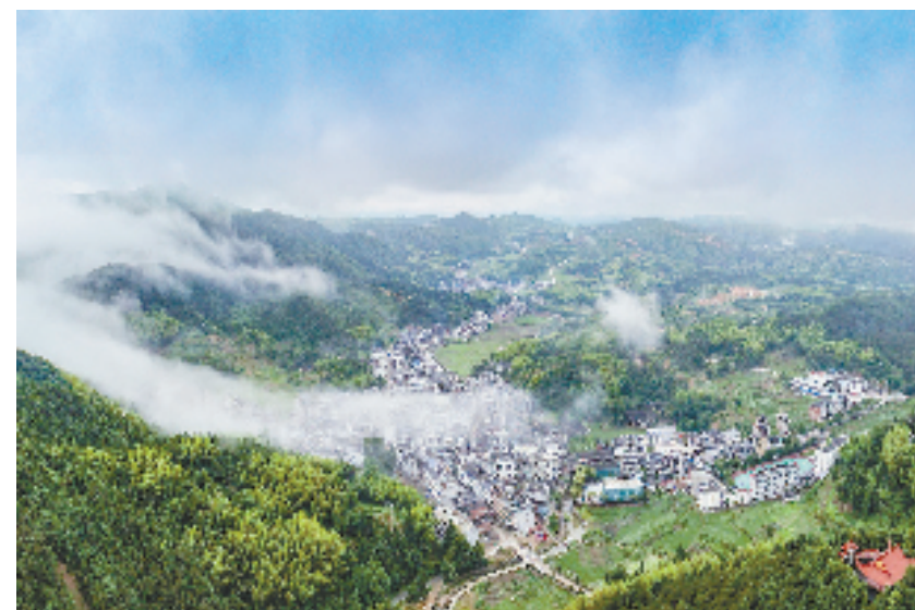
温州财政坚持农业农村优先发展，大力保障“未来乡村”试点建设，促进共同富裕，图为泰顺县柳峰乡墩头村。

如何发挥财政资金的撬动作用，激活乡村活力，推动产业发展，实现富民增收？温州财政坚持农业农村优先发展，投入84.4亿元保障“未来乡村”试点、田园综合体创建、农业双强、预制菜产业发展等重点任务。持续深化财政