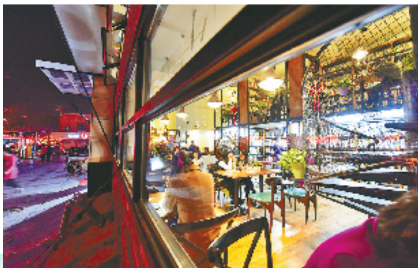
温州集中财力惠民生，近年来城市书房遍布全市，图为鹿城文化中心城市书房。

争做精明“大管家”，坚持以政府过“紧日子”换百姓过“好日子”，迭代《党政机关过紧日子负面清单》，去年全市非刚性、非重点支出压减9.5亿元，确保将宝贵的财政资金用在发展紧要处、民生急需上，更好节约裕民。