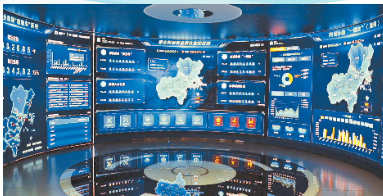
温州财政积极探索打造“惠企利民资金直达智控在线”平台

高质量发展建设共同富裕示范区，是党中央赋予浙江的光荣使命。在建设共同富裕示范区的进程中，财政承担着“做大蛋糕”“分好蛋糕”“引领变革”的重要作用。为了回答好“共同富裕上，