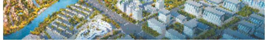
江南医谷鸟瞰图

2023年，江南街道将继续以文化为媒，整合上江百花园AAA级景区、宿仙千亩茶园、大岭头柴古唐赛道等优势资源，探索乡土文化体验、民宿、营地旅游等融合发展新路径，打造文旅融合新高地，让文旅产业成为江南新名片。