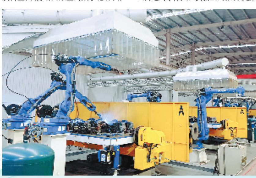
浙江正特智能机器人在自动焊接生产线上工作

一把遮阳伞，撑起大市场。户外休闲用品产业是大田街道的支柱产业，历经30年的发展，从贴牌生产向自主研发转型，从劳动密集型向数字化、自动