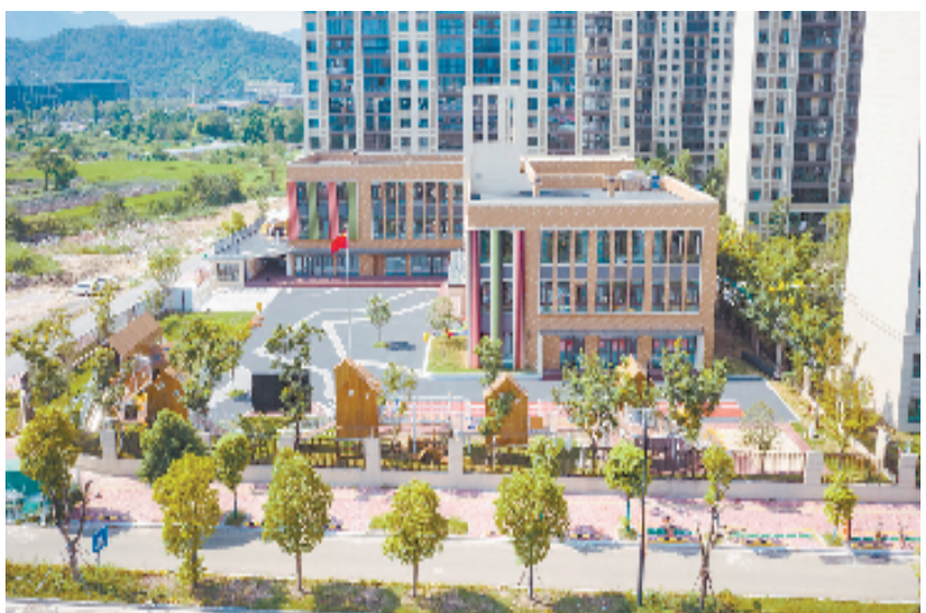
大田街道中心幼儿园复合分园

大田板龙、骨牌锣鼓、杜鹃鸟山歌……这座自古繁华的集镇，有着说不完的风土人情、历史叙事和文化内涵，留下许多特色鲜明的非物质文化遗产。