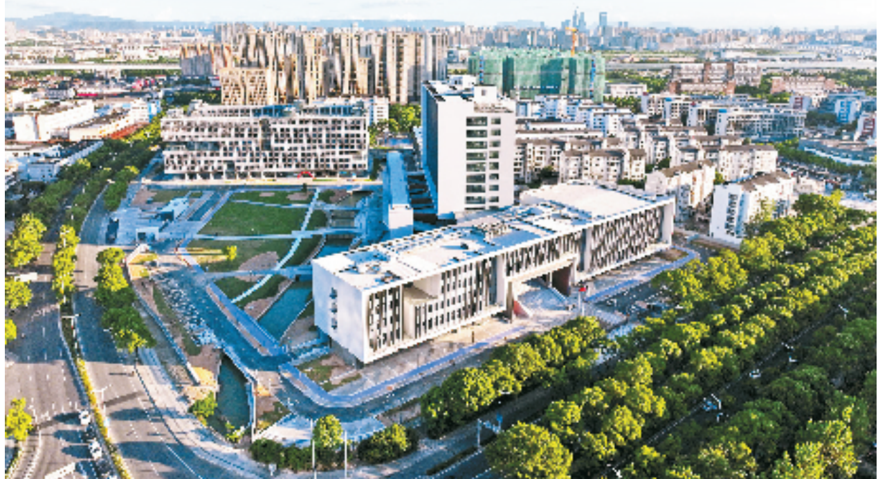
国科大宁波材料工程学院