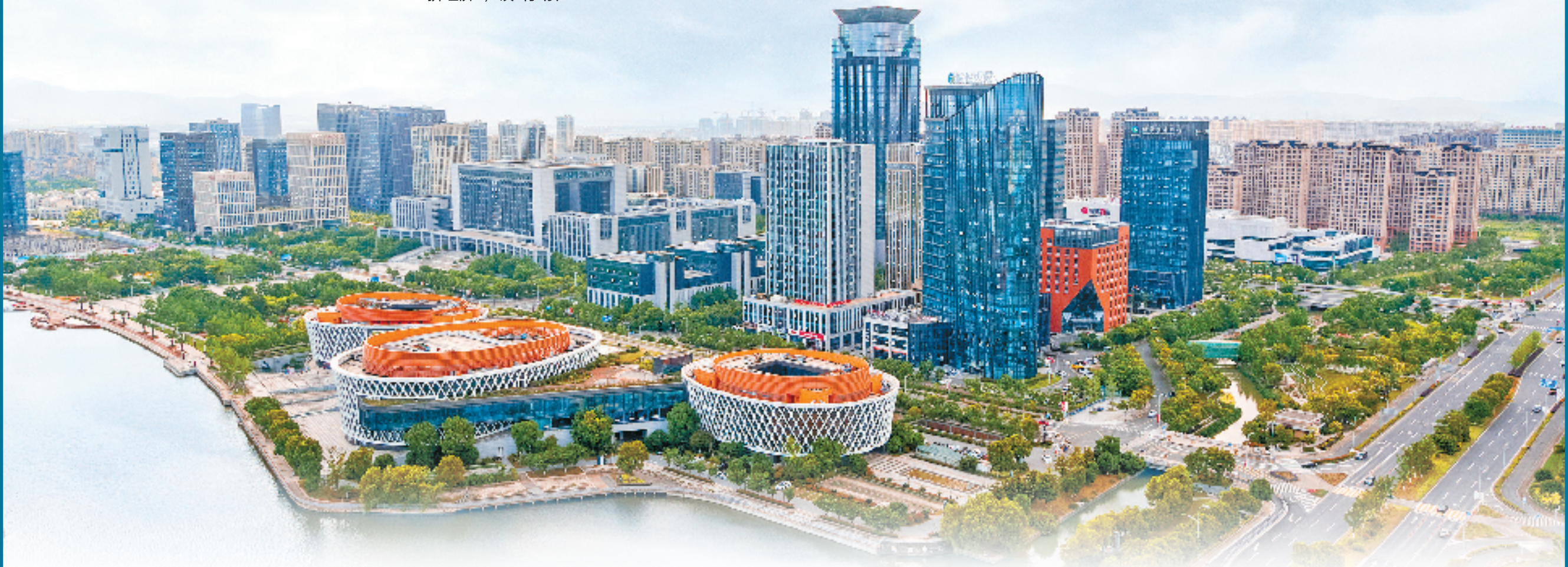
日新月异镇海新城