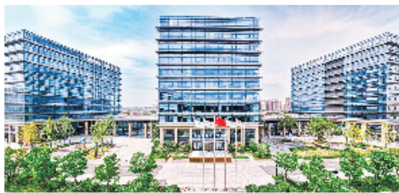
东方理工高等研究院