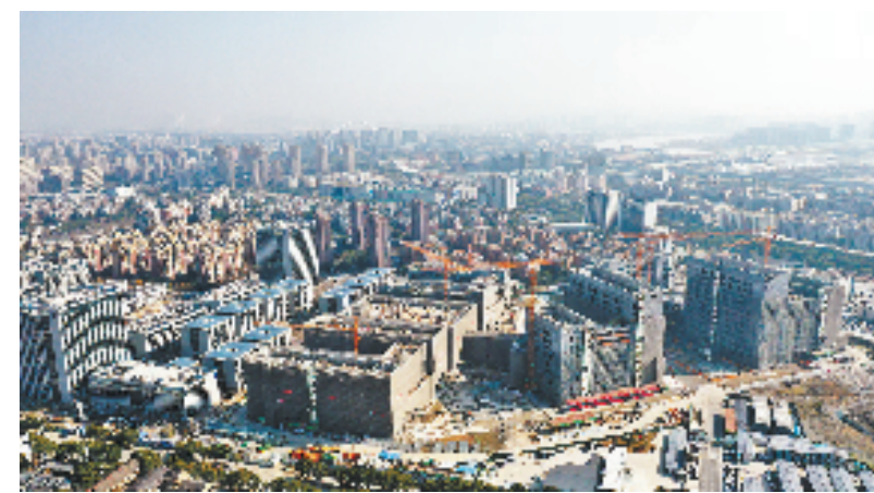
建设中的甬江实验室新址