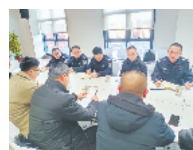
吴兴公安领导带队走访大东吴集团了解企业生产经营情况

企业的真实需求，用公安力量助推企业社会治理能力，最终目的，是助推实现‘五个一’目标，大力支持企业稳岗开工促生产，助力企业‘开门稳、开门红’，为奋力谱写中国式现代化精彩湖州新篇章贡献公安力量。”上述负责人说。