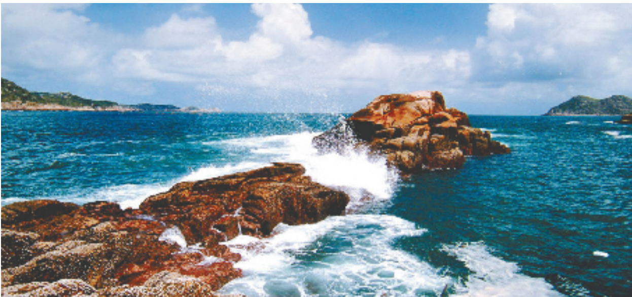
南麂列岛保护区龙船礁

湿地被誉为“地球之肾”和“物种基因库”，具有重要的生态服务功能，在维护生物多样性等方面作用显著。