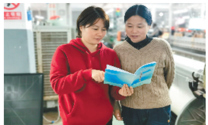
湖州市人大代表为企业讲解政策

双林镇创新人大代表“网格+”工作模式，针对助力高新技术企业培育等重点工作，组织、引导相关领域的人大代表进网格、进企业开展视察调研活动，坚持问题导向、需求导向，让人大代表来助力，让行家来发言，极大丰富了人大代表履职作为的内容。此外，镇人大认真收集代表提出的意见建议，转交政府及其职能部门，加大督办力度，让代表的话“真管用”，形成正向反馈激励和监督闭环，实现让人大代表“履职在当地、服务在当地、作用发挥在当地”，真正让群众搭上“代表直通车”。