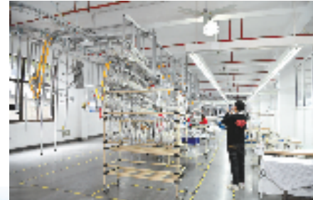
现代化的童装生产车间