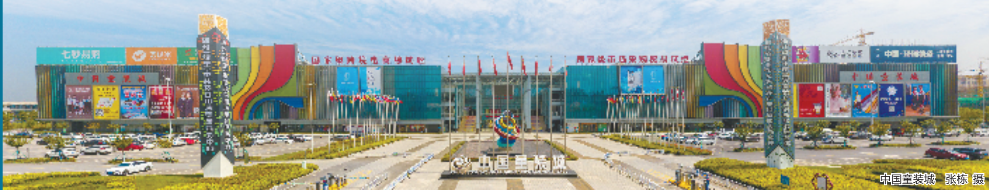
中国童装城 张栋 摄

乘风破浪，再启新程。带着这样的新使命奔向共同富裕的大道，织里镇45万新老居民将同心同力，奋勇拼搏、勇于担当，全力打造“社会治理先行地、美好生活试验区”，为全力推进品质湖州、美好吴兴建设贡献织里力量、展现新作为，朝着“中国童装之都、太湖南岸创业新城”的目标阔步前行。