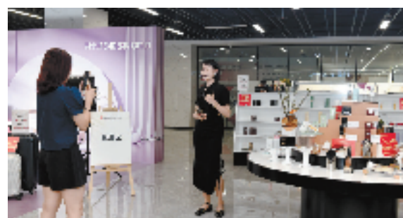
象屿跨境电商直播