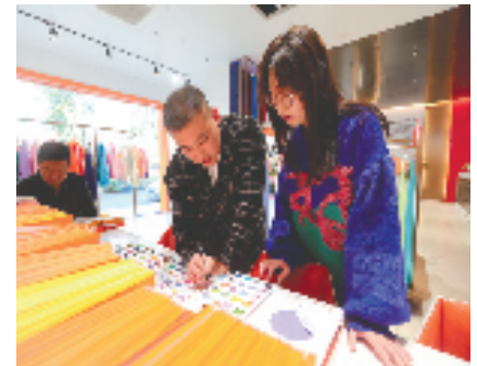
选购童装面料

转型之中，织里镇纵深探索“产城人”融合，成为一座45万人口生活的现代化小城市，也走出了一条厚植优势释放动能的裂变之路：连续10年入围全国百强镇，连续10年获全省小城市培育试点考核优秀。