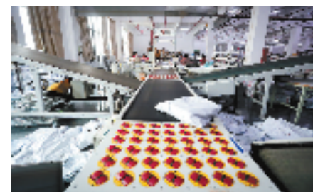
PDA条码作业系统将童装拣货、发货效率提高70%

几十年来，织里镇从“扁担街”一路走来，用勤劳和汗水书写了无数生动鲜活的故事。目前，织里已经形成了覆盖童装设计、加工、销售、面辅料供应、物流仓储等相对完整的产业链，成为中国规模最大、分工协作最紧密的童装产业集群，童装富民的模式就此形成。