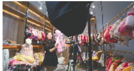
直播带货开拓新市场