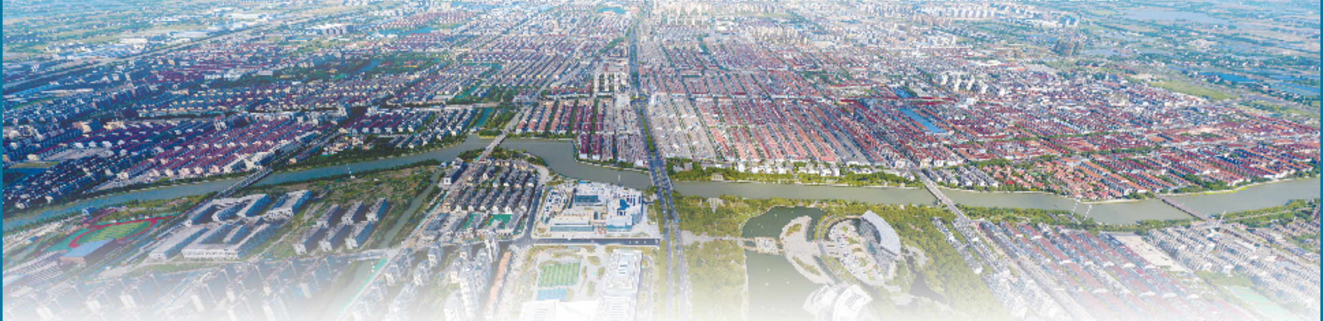
奋进中的织里

在新征程上扎实推进共同富裕，当下的织里，一头挑着国内，一头挑着国外，正向着“世界童装之都”的目标，奋力演绎新时代的“扁担精神”。