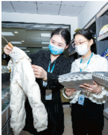
设计师讨论配色方案

在危机中孕育先机，于变局中开新局。过去的3年，当地政府持续提升全市块状经济典型代表的竞争力，抓好童装生产、销售、服务三大“上线”趋势，几乎所有织里的童装企业都实现了“逆势翻盘”，通过“线上销售+直播带货”率先开拓新市场。