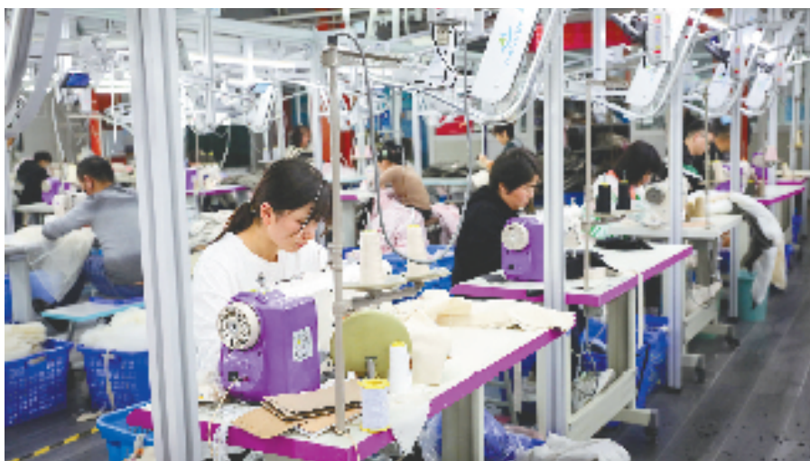
开足马力生产童装