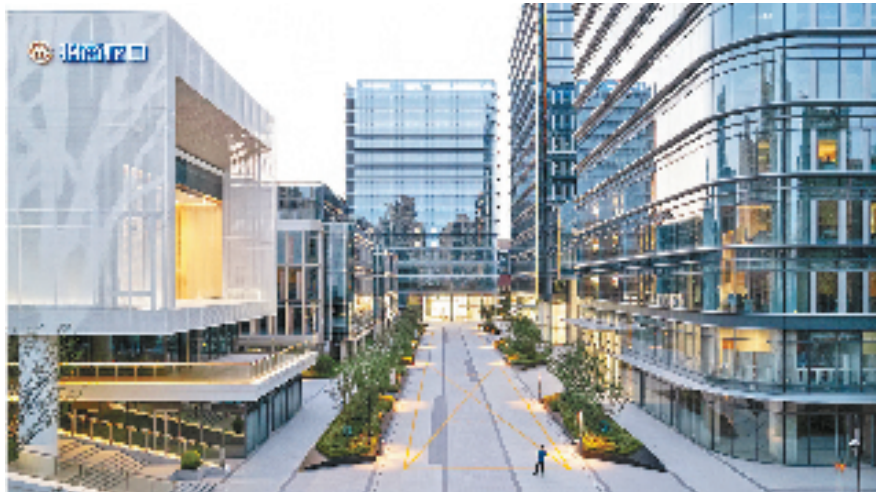
招商蛇口·运河网谷