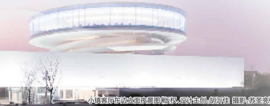
小镇客厅东边立面夜景图(版权:设计主创:胡沉佳 摄影:苏圣凯)