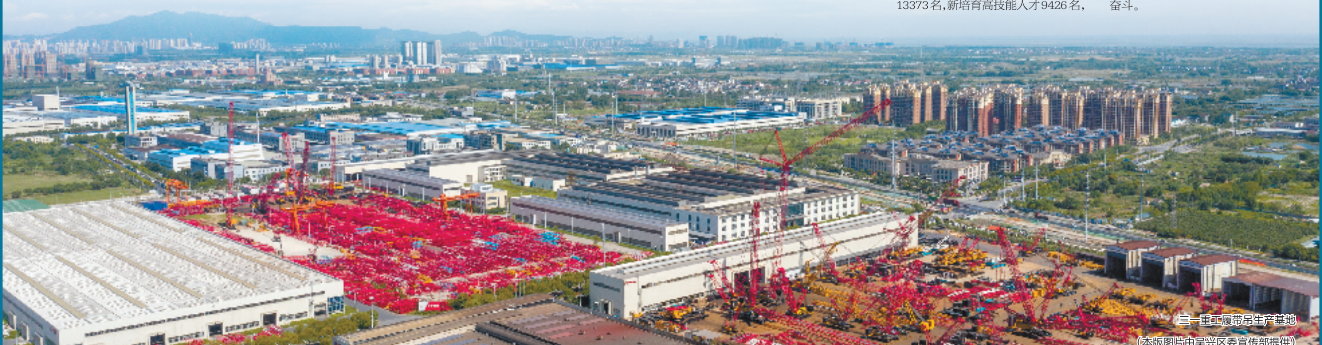
三一重工履带吊生产基地

走过千山万水,仍需跋山涉水。新的一年,竞逐发展新赛道,吴兴将着力推动产业集聚提升、全域有机更新、共富提质扩面、新城起势见效,在创新、改革攻坚中抢占先机,不断开辟市区一体、奔跑赶超新局面,为争先迈开中国式现代化吴兴实践新步伐而不懈奋斗。