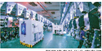
新凤鸣自动化生产车间

在“吴兴织里港”海关监管作业场所,现在每天都有打包出口的童装发往世界各地。近两年,吴兴发挥市场采购贸易和跨境电商综试区两大国家级试点优势,加快织里港物流产业园建设,落实出口奖励政策,打造以世界童品展销为特色的中国童品城。2022年以来,织里童装出口销售持续领跑全国同批次试点,出口目的地已覆盖全球126个国家和