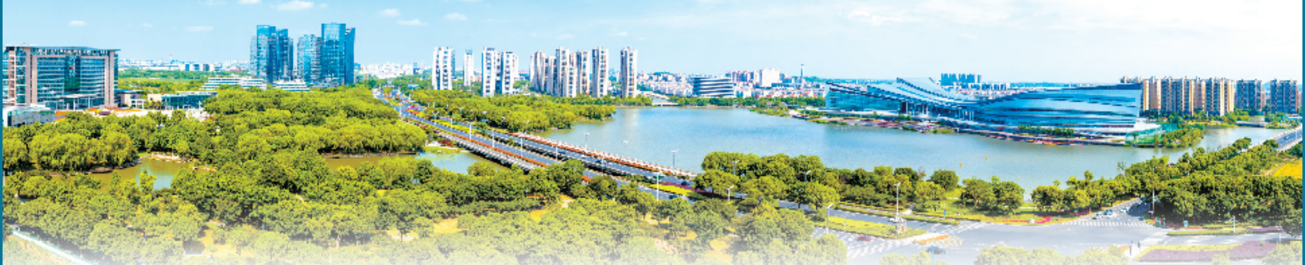
风光旖旎的吴兴东部新城