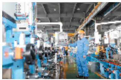
金洲管道自动化生产线

水积而鱼聚,木茂而鸟集。2022年,吴兴引进入选国家级领军人才19名,居湖州市第一位;完成省级以上人才全职到岗22人次,引进培育省领军型创新创业团队1个、市级领军人才41名,新引进青年博士57名、青年大学生13373名,新培育高技能人才9426名,