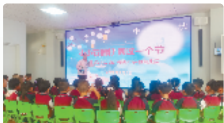
乌什·衢州幼儿园同过中秋节

实施衢州乌什联动招商新机制,衢州市援疆指挥部全员投身招商,与本地干部合力组建招商引资专班;成立了乌什新乡贤联络处,为乌什解决人脉资源稀缺的问题;创新“燕山飞龙”经济型干部孵化行动,选派两批共20名乌什年轻干部先后前往衢州经济发展一线挂职锻炼。在一系列新机制、新行动下,华盛纺织、天和针织、麦伦工贸、睿丁生物等一批企业项目纷纷落地乌什,落地项目和资金均创历史新高。