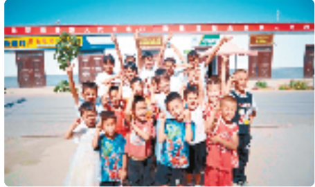
衢州智慧新村的笑脸

数据显示:3年来,衢州市援疆指挥部共实施援疆项目91个,安排援疆资金8.4亿元,乌什县电商产业园、青少年活动中心、人才公寓……一座座地标建筑拔地而起,为乌什县经济社会发展注入强劲动力。