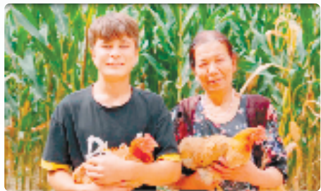
村民们捧着“燕山飞鸡”