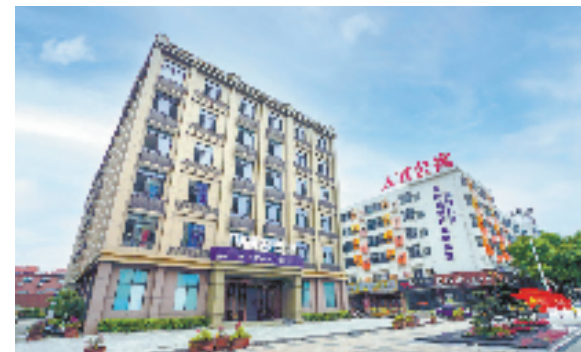
中国数安港开创新数据资源法庭、仲裁院、公证中心3个“全国先河”