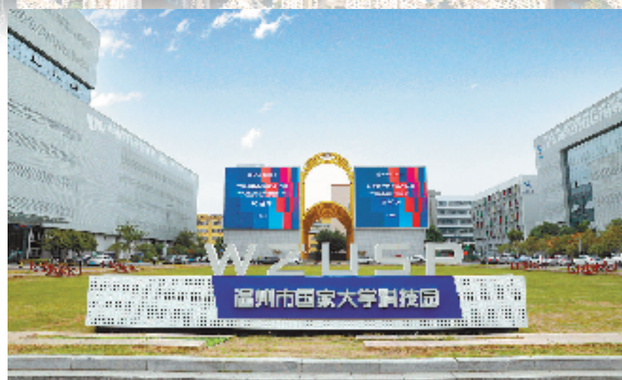
温州市国家大学科技园为瓯海打造现代化科创策源未来新城提供了坚实支撑

让更多成果从“实验室”走向“生产线”。瓯海还深化“一核多点”成果转化服务体系,成功帮助8项高校院所全新技术成果精准匹配落地到瓯海企业,实现成果转化落地312项、发明专利产业化43项,科技成果(竞价)拍卖成交额累计达1.46亿元。