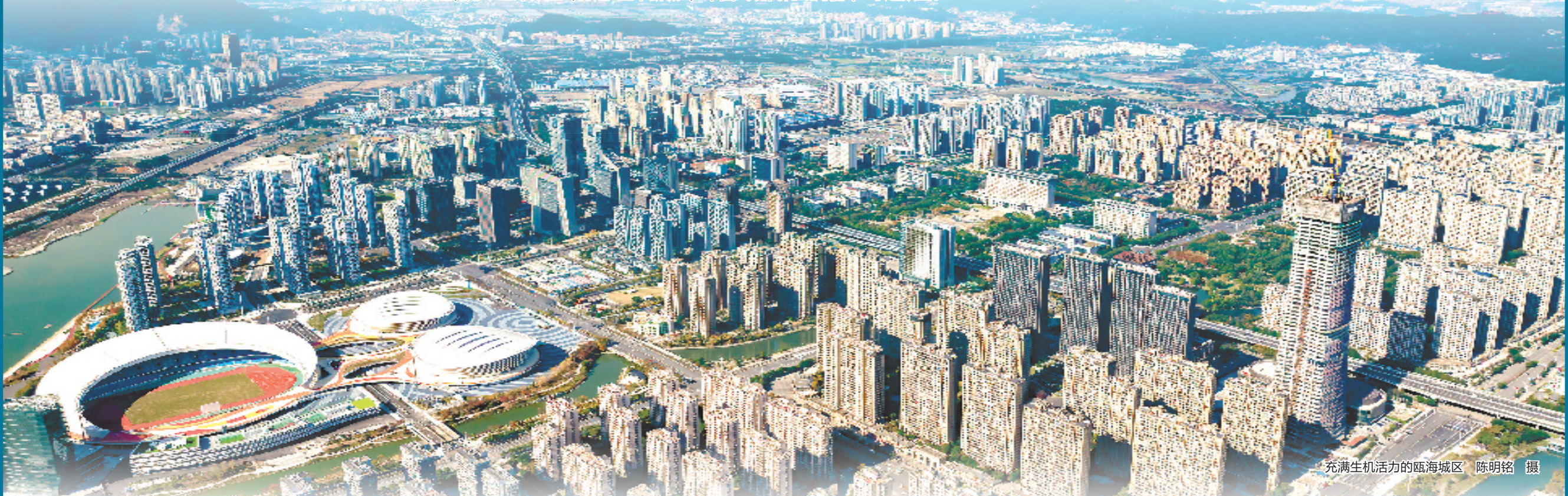
充满生机活力的瓯海城区

岁末年初,瓯海全区又吹响奋进号角。日前召开的瓯海区委十届四次全体(扩大)会议强调,瓯海将锚定更高水平“科教新区、山水瓯海”战略目标不动摇,勇闯未来发展赛道,激发科技创新强劲动能,持之以恒深化产业转型,让城市颜值一年更比一年靓,让更多幸福在群众家门口升级。竞逐发展新赛道,放大“五个效应”,打造“五个新城”,“中国式现代化瓯海篇章”呼之欲出。