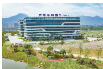
正在集聚爆发出巨大能量的中国基因药谷

全市首家生命健康省级高新技术产业园区获批创建,创新联合体模式全省推广,中国基因药谷获批全省唯一药学类国家工程研究中心……2022年,瓯海区科创事业连结硕果。