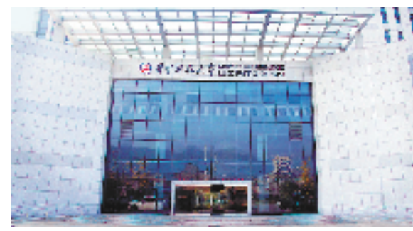
位于瓯海的华中科技大学温州先进制造技术研究院

整体智治激活基层效能。瓯海区把镇街“协同化治理”改革作为基层全面深化改革的“一号课题”,实现镇街矛盾调中心全覆盖,推进“微网格”“平安联盟”建设,疏通基层治理“毛细血管”,谋划打造“一竿子插到底”的社会治理信息平台覆盖多领域的数字分析系统,确保上下联动、反应快速。