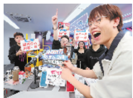
瓯海大力培育发展直播经济

迈向全龄友好型共富高地。瓯海聚力打造幸福增长极:首先,友好体系全龄贯通,推行养老四场景、教育五重构、托育六模式,打好品牌托管、强校共建、名师名校长招引“组合拳”,学前教育、普惠养老获浙江省政府督查激励;再者,帮扶体系全面贯通,全域创建“共享社·幸福