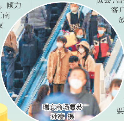
瑞安商场复苏

城市烟火气,离不开消费场景打造。近年来,瑞安市积极推进夜间经济工作,围绕“三核四区五圈多态”的空间布局,扎实推进“温瑞塘河休闲文化商业带”“环万松山运动休闲”“飞云江北岸夜间消费特色街”三座夜坐标建设。倾力提升安阳、玉海、滨海、塘下、江南五大商圈,重点打造“塘河夜游”等一批夜经济重点项目;通过政府搭台、企业参与、商家让利的方式,大力举办夜经济消费促进活动;培育多元化夜间经济业态,全方位刺激夜间消费需求,加速形