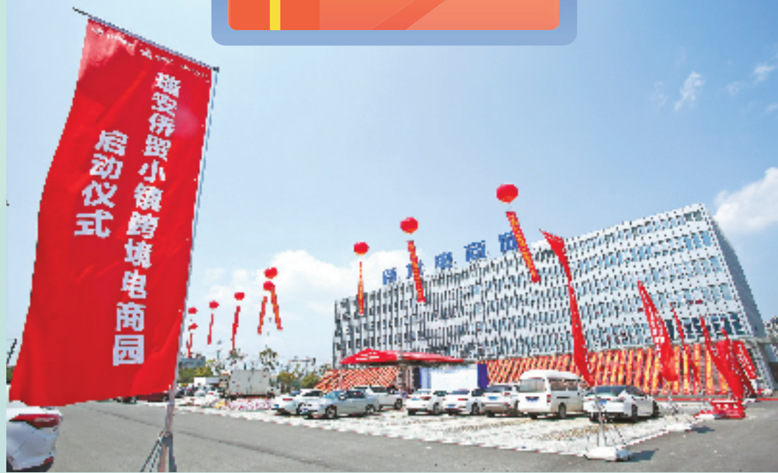
瑞安跨境电商园正式投入运营