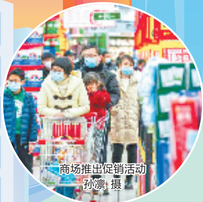
商场推出促销活动

以创新驱动、人才强市赋能“两个先行”,以改革开放、变革重塑赋能“两个先行”……瑞安把各项工作放到以中国式现代化全面推进中华民族伟大复兴的宏大场景中谋划推进,增强“闯”的劲头、“拼”的精神、“创”的勇气,再燃激情、再展雄风,奋力推动“八个新跨越”,高水平打造“青春都市·幸福瑞安”,奋力推进“两个先行”,勇闯新路谱写中国式现代化瑞安篇章。