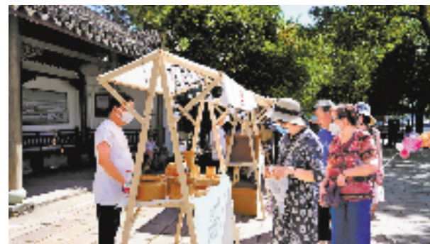
河阳古民居景区内消费复苏的场景