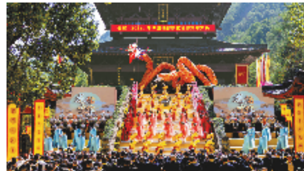
中国仙都祭祀轩辕黄帝大典

一个县域的发展总是综合了各方面的力量,来自于政府部门的有为、老百姓的支持和首创精神、工业企业家的热情干劲……这就是区域的综合竞争力,在缙云,人们已经看到了这种竞争力,所以,2023年,让我们一起奔跑,让我们一起沸腾。