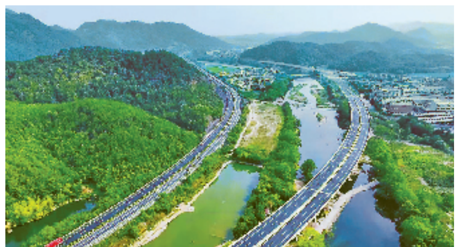
330国道缙云东渡至永康交界段改建工程通车