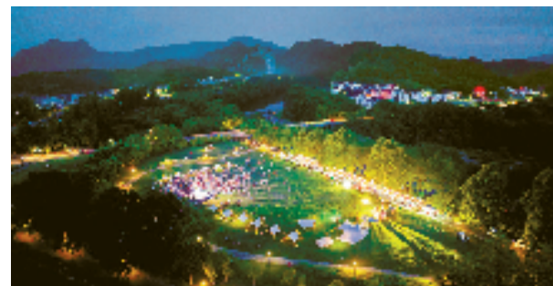
仙都大草坪露营地