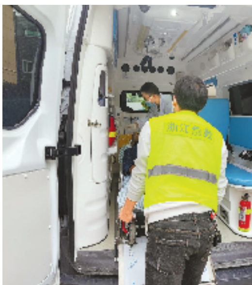
智慧流动医院巡回诊疗车开进沙溪村。