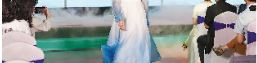
在杭州举行的“宋潮”风雅主题服装大秀